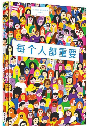
克利丝汀·罗希夫特 著

内容简介: 表面看来,这是一本玩数字游戏的图画书,但实际上,它是一本包含着我们每个人生命故事的推理书。在这个奇妙的游戏里,作者埋下了许多隐秘的线索,每个数字背后都隐藏着不同性格与相貌的人,每条线索都在开启一个新故事,小读者被邀请进入书中,去寻找人与人之间的关联以及其中的故事,由此获得极大的观察和侦探乐趣。