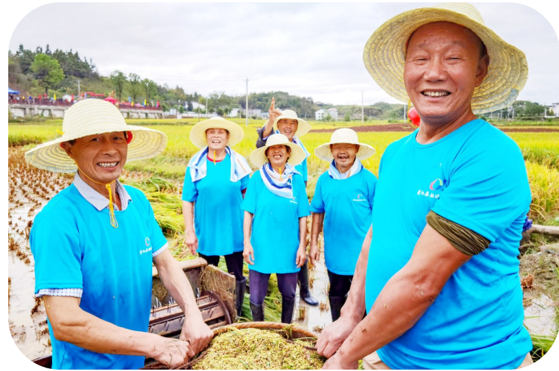
“颗粒归仓”割谷比赛中获胜的黄队和蓝队