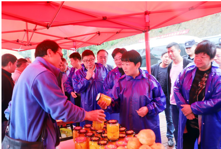
市、县领导观摩崇阳特色农产品展销