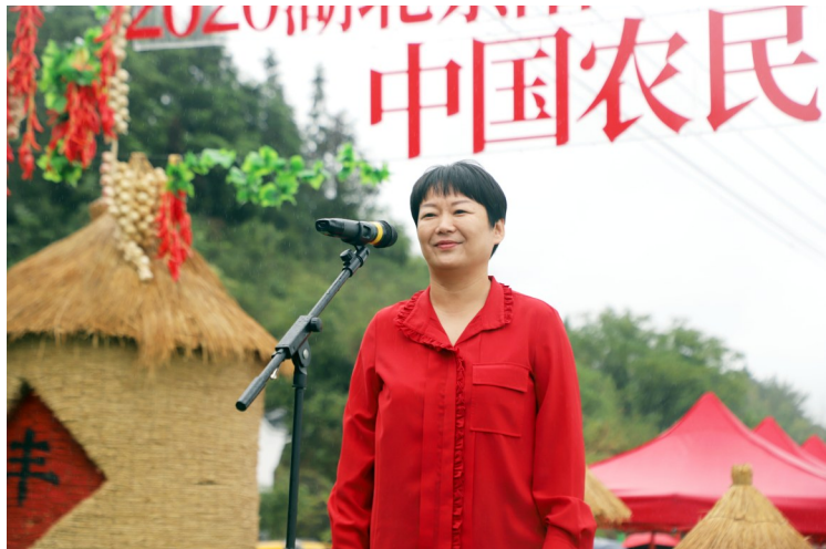
市委常委、崇阳县委书记杭莺宣布“崇阳县2020年中国农民丰收节”开幕