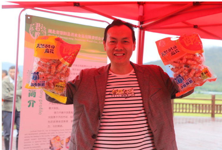
宣传展示特色农产品