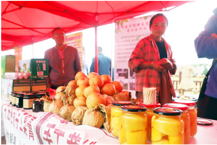
崇阳特色农产品展区