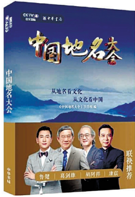
《中国地名大会》节目组编

《中国地名大会》以地名知识为载体，从地理、历史、语言、文学、民俗等各个角度全方位展现中华大地的万千风貌，引导人们发现地名背后深厚的人文底蕴、文化华彩和人生百态。该书在电视节目的基础上，提炼精华，条分缕析，使电视内容得到了完整呈现。书中出现的地名大到数省区域，小到一条街道，都能找到其背后蕴含的历史文化与人文故事，勾起那些既精彩又独特的乡恋记忆。