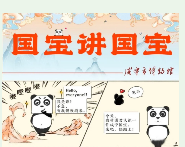
卡通形象:熊猫“小仙肉”