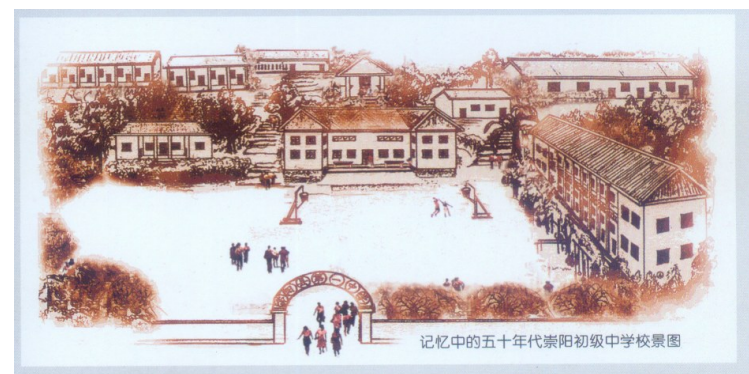
记忆中的五十年代崇阳初级中学景图