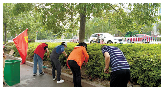
5月1日,通城县局烟草专卖局组织党员干部参与全民洁城活动,通过劳动的形式欢度“五一”节。