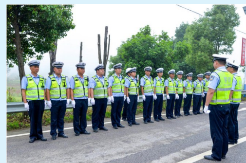
在蓝天与大地之间巍然高耸,在车水马龙和人来人往之中傲然挺立,他们是交通安全的导航灯,他们是守护生命的保护神,以规范的指挥维护稳定保平安。