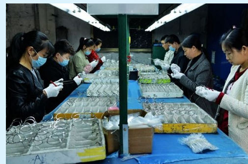
通山县华粤眼镜厂工人正在全神贯注地加工镜框,每一个人都自己平凡的岗位上为了美好的生活而努力奋斗着。