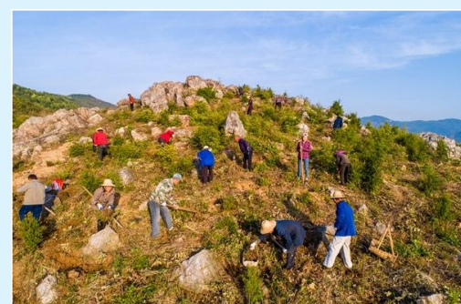
通山县蕪蕪乡金坑村村民积极响应政府号召开荒造林,用勤劳的双手为美丽的家乡多添一片绿色,为美好的生活播撒一片希望。