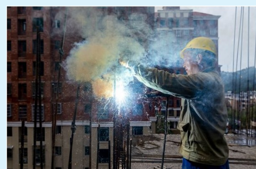
建筑工地上,建筑工人们正在抢抓时间赶工期,争分夺秒恢复城市建设,飞溅的火花映照出焊接工人黝黑的脸庞,也映照出劳动人民的勤劳朴实和匠心精神。