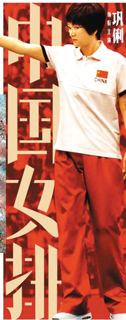
2020年春节档部分影片海报

2020年春节档电影都在强调自身讲述的是能引起中国观众共鸣的故事。徐峥说,他在拍摄《囧妈》的时候“有一个小小的心愿:大家看了电影之后可以回家跟妈妈有一个拥抱”。他希望电影中的家庭