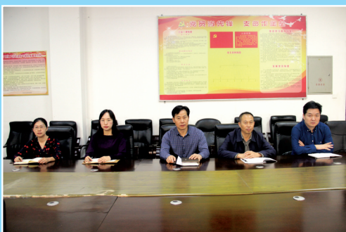
县工商联班子成员定期开展学习