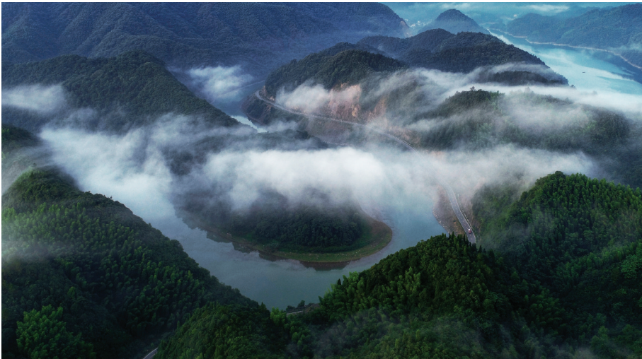
《曲湾山乡路》 作者:沈小龙