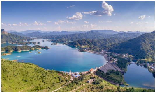
《青山水库》 作者:周伟