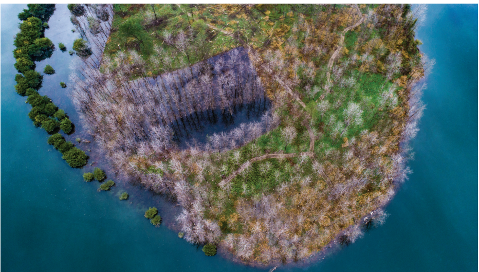
《湿地之眼》 作者:徐辉