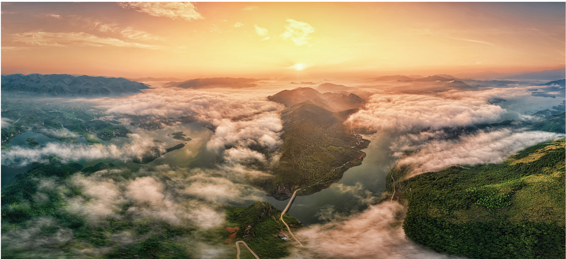
《岭上红披絮帽》 作者:孙章辉