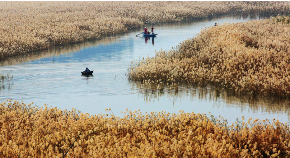
《芦苇荡风情》 作者:周建军