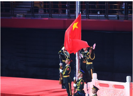
闭幕式上的升国旗仪式