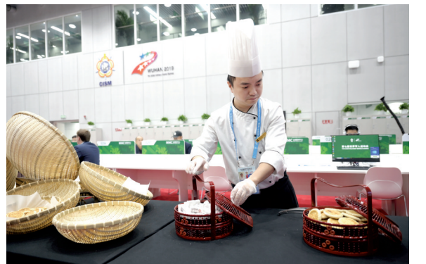
10月17日,工作人员在武汉军运会主媒体中心新闻工作室内准备茶点。