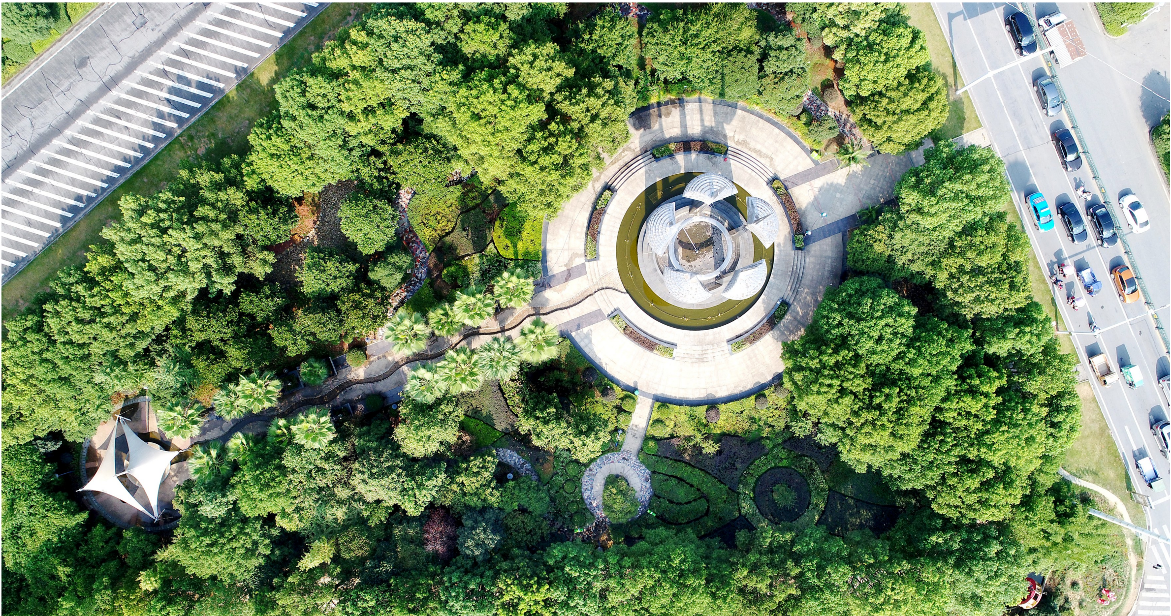
在喧闹的城市中领略一份自然的清净

如今的咸宁城区,人在园中、城在林中,花香四溢、开窗见绿。出门不到20分钟就能找到一处小游园,移步小游园,犹入画境中,市民幸福指数不断攀升。