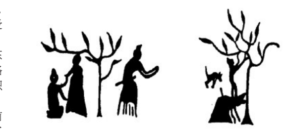
图1 战国“采桑射猎图”上的采桑图

到了商代(约公元前16世纪至公元前11世纪),我国的蚕桑生产和丝织手工业有了进一步发展,并受到统治者的重视。 丝织品不仅成为统治者日常生活中不可缺少的东西,而且还成为他们死后的殉葬品。考古工作者在洛阳等地商朝贵族的墓葬中,就曾发现不少腐烂的丝织品遗痕。 我国西周至春秋时期(公元前770年至公元前476年)的一部诗歌总集《诗经》里,有不少诗篇描绘了妇女们养蚕织帛的劳动情景。比如《邶风·七月》中这一段著名的诗句,就是描述采桑养蚕的景况的:“七月流火,八月萑苇。蚕月条桑,取彼斧斯,以伐远扬,猗彼女桑。”《郑风·将仲子》有这样的诗句:“将仲子兮,无逾我墙,无折我树桑!”这是一对私恋中的青年男女,姑娘告诉她小二哥(仲子),不让他爬墙到院子里私会,以免弄断了桑树枝。尽管她一再声明,不是心疼桑树,而是怕父兄知道了责骂,但是院子里的桑树,对她家来说还是至关重要的。《卫风·氓》开头4句则说的是麻布和蚕丝的物物交换:“氓之蚩蚩,抱布贸丝。匪来贸丝,来即我谋。” 战国时代的孟子说:“五亩之宅,树之以桑,五十者可以衣帛矣。”也说明了种桑养蚕对于当时人们的重要性。