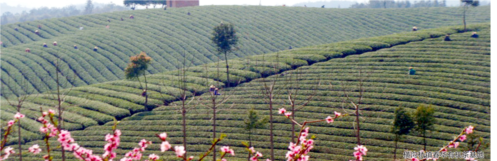
横沟镇春华有期茶基地