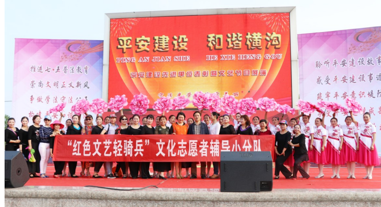
平安创建文艺展演活动