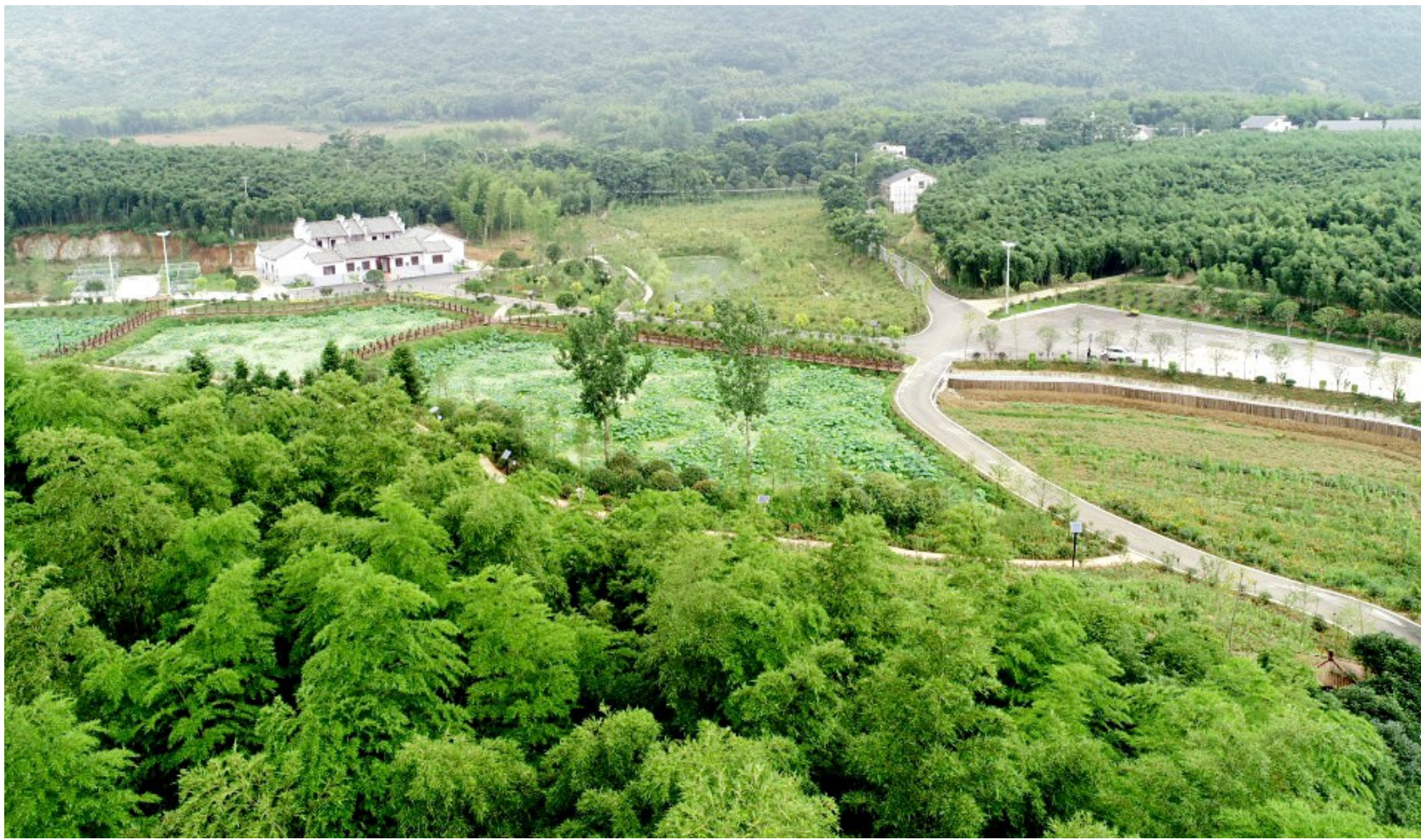
生机勃勃的雷竹园