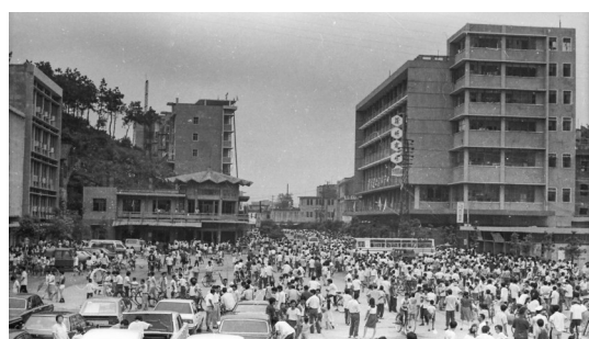
1983年原蒲圻城区商业中心，市民在等候看电影