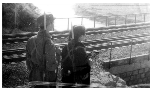
1967年原咸宁县民兵守护西河大桥