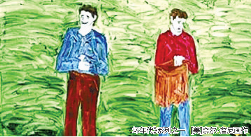
《坏年代》系列之一 [美]奈尔·詹尼画作

也就是说，坏画是艺术家能画好而故意画坏的，它代表了一种反讽、批判、颠覆和挑衅——我就这样画了，怎么样，不服气，来打我呀。