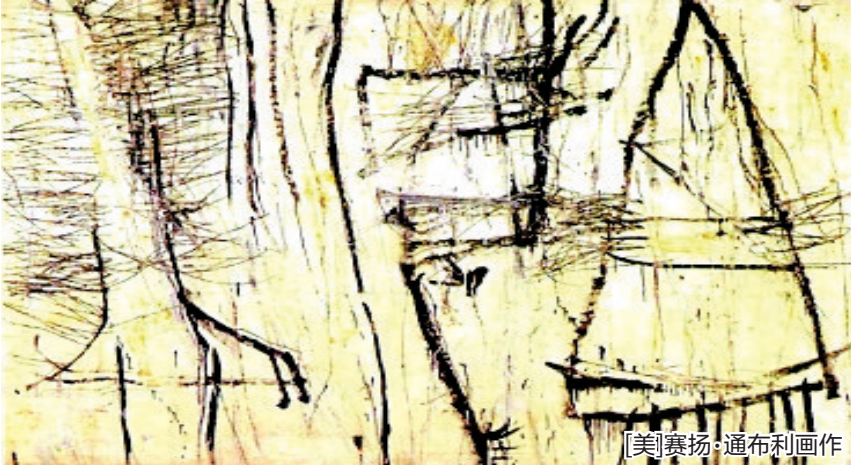
[美]赛扬·通布利画作