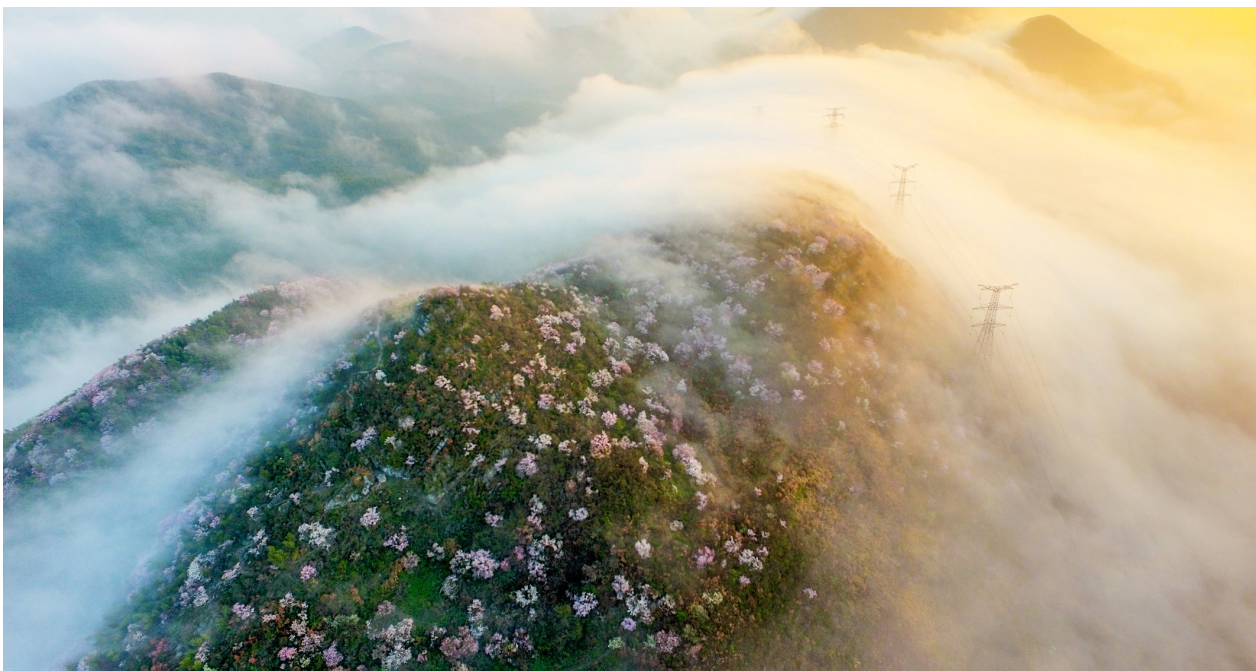
葛仙山流云花锦簇