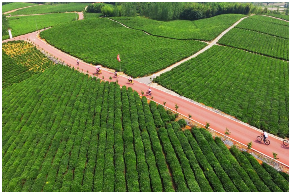
万亩茶园绿色骑行