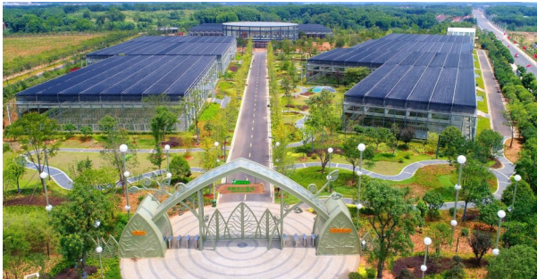
田野现代农业观光园