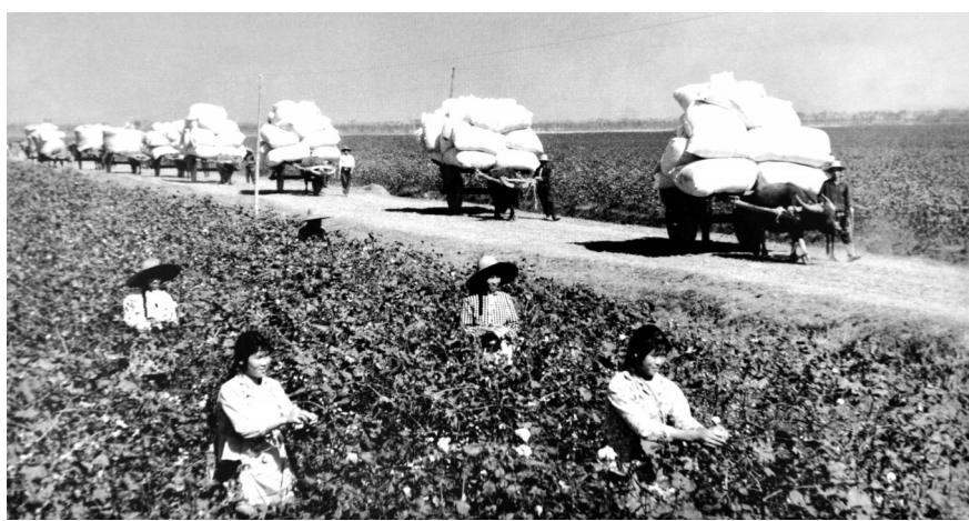
1973年原嘉鱼簰洲合镇乡红星大队收棉花