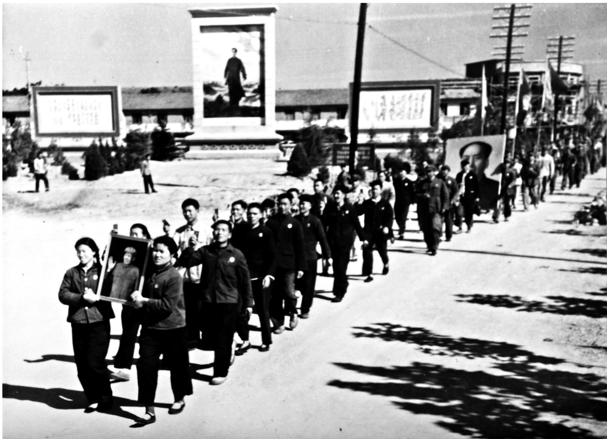
1974年拍于温泉中心花坛