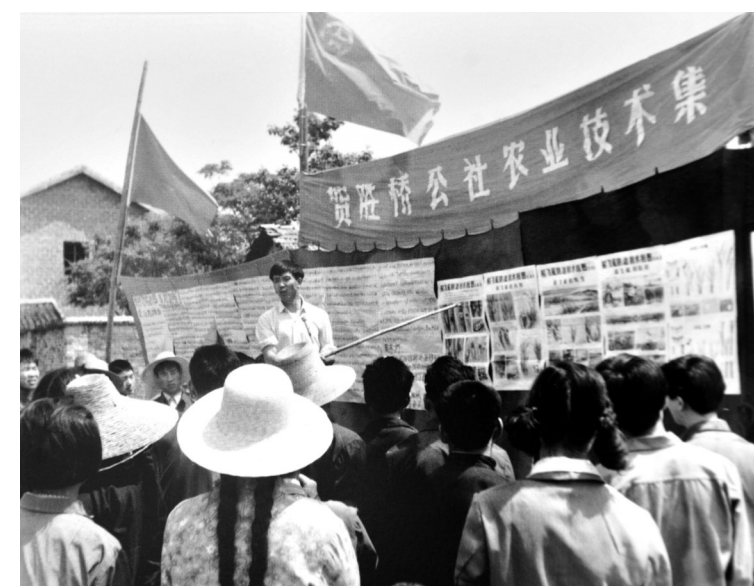
1982年原咸宁县贺胜桥公社科技赶集