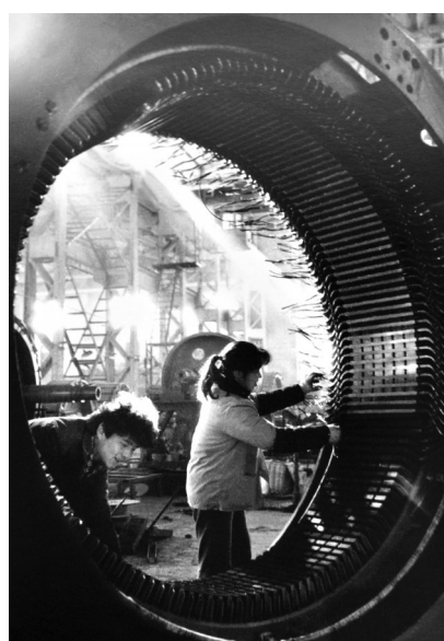
1986年原湖北二电机厂