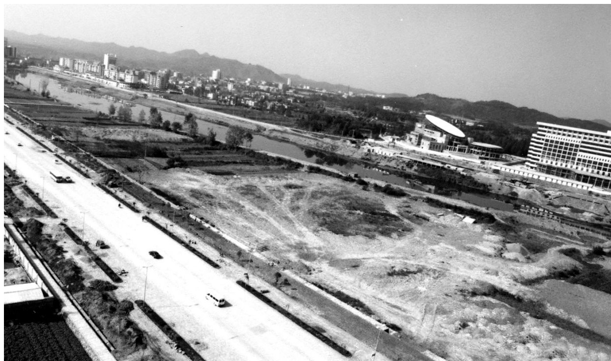
2001年在建的人民广场