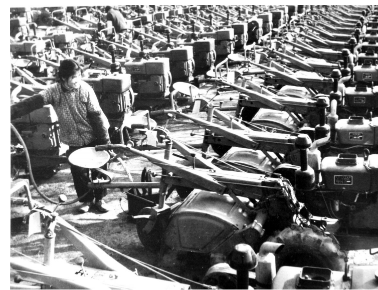
1977年通山县拖拉机配件生产车间