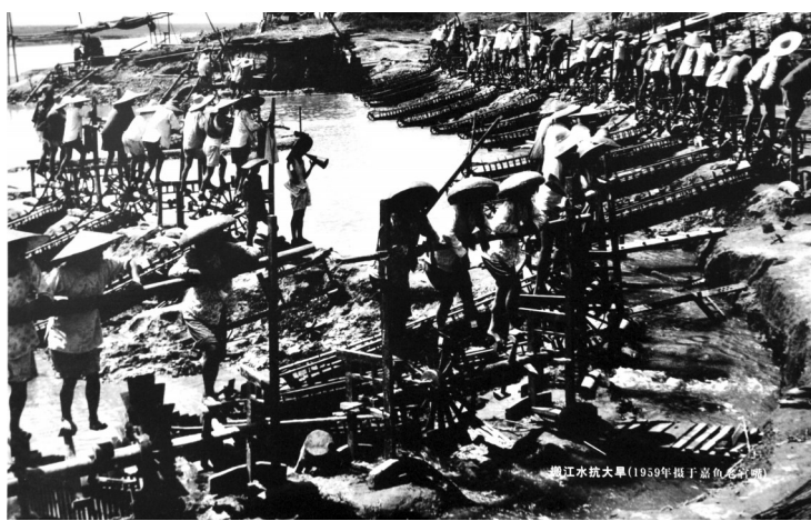
1975年嘉鱼渡普搬江水抗大旱