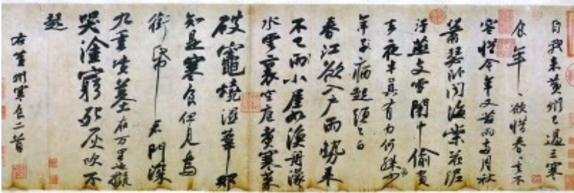
北宋苏轼书《寒食帖》

清明之所以能从节气演变为传统节日，与它的两个前身寒食节和上巳节有关。早期寒食节的日期不定，大约在魏晋时期固定在冬至后第105天，主要的习俗是禁火、冷食。关于寒食节的起源主要有禁火说、改火说和纪念介子推说三种。《周礼》记载“中春，以木铎修火禁于国中”，意思是说仲春的时候，要有专门的人负责敲着铃铛宣传禁火。春天大火星(心宿二)会在东方出现，东方属木，古人担心这会引发火灾，因而要禁火。唐代李潜的《刊误》中则认为，古时“四时皆改其火”，而“自秦以降，渐至简易，唯以春是一岁之首，止一钻燧。而适当改火之时，是为寒食节之后。既曰就