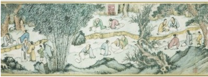
明代钱穀绘《兰亭修禊图》(局部)

寒食节作为唐代的法定假日，除了上坟扫墓外，还有很多丰富的活动。朝廷和王公大臣会在节日当天举行宴会，食品以冷食为主，类似于现在