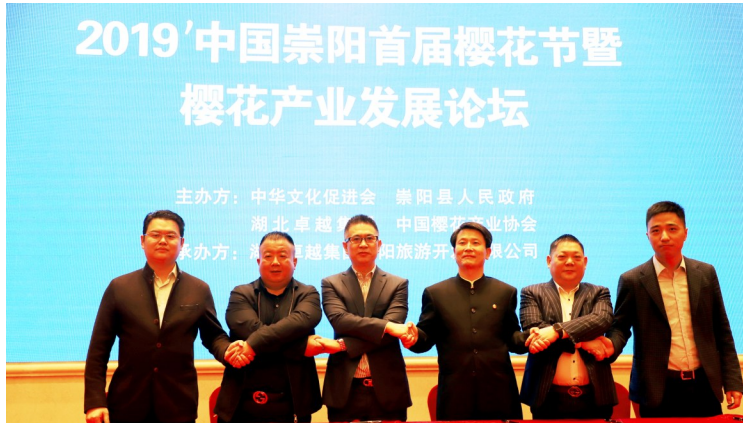
企业集团签约成立樱花文旅产业联盟