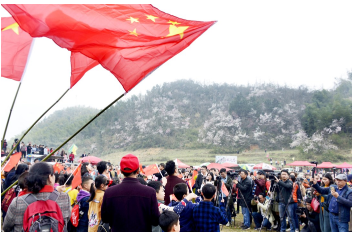
樱花节开幕现场