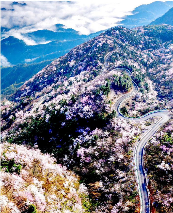
崇阳龙泉山脉樱花