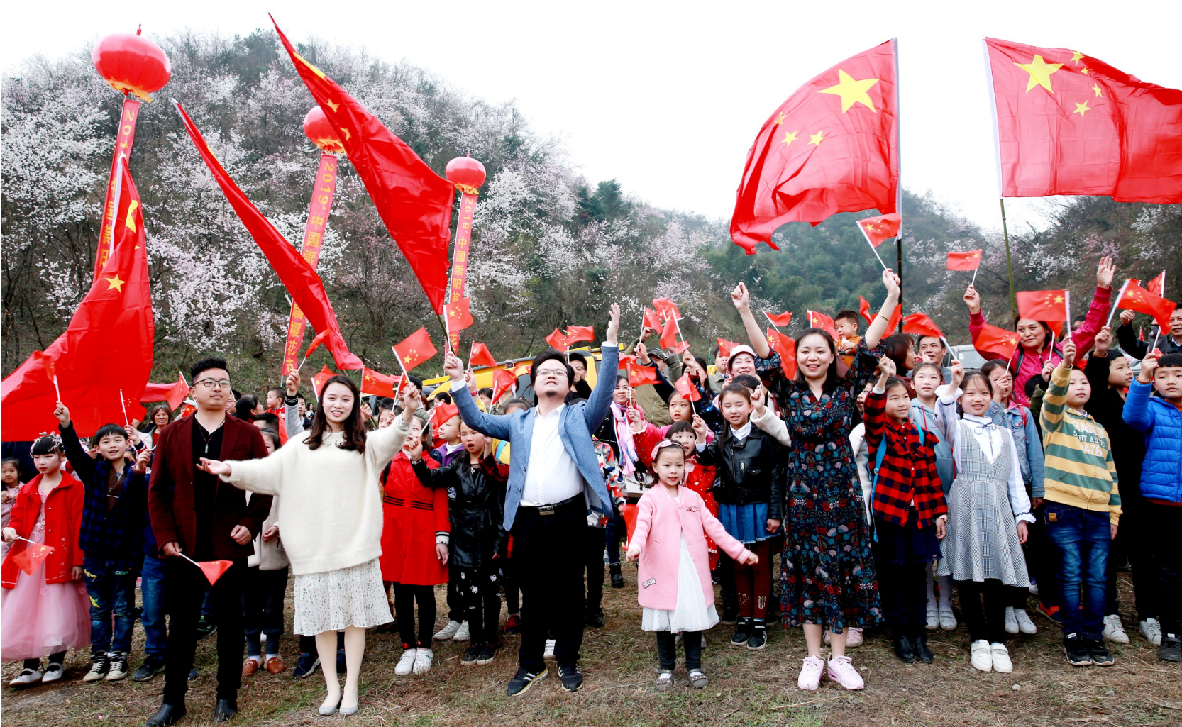
《我和我的祖国》歌声响彻樱花谷

“全球80%野樱在中国,中国野樱80%在崇阳。”何宗儒认为,崇阳发展樱花经济基础好,有卓越集团等大公司投入,前景看好。