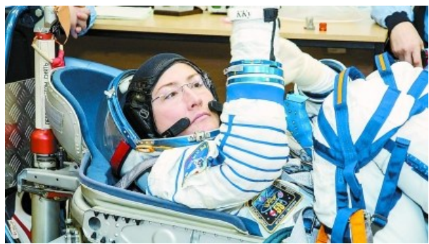
原拟定本次参加太空行走的美国女航天员科克(左)和麦克莱恩(右)。

现在,已有多项女子太空行走的世界纪录问世。例如,1984年7月25日,苏联的萨维茨卡娅成为世界太空行走第一女;美国的惠特森目前保持着女性以及美国进行太空行走次数最多的纪录:10次,累计60小时21分钟;单次太空行走时间最长的是美国女航天员赫尔姆斯与男航天员沃斯一起创造的,他们于2001年3月11日在太空行走了8小时56分钟。