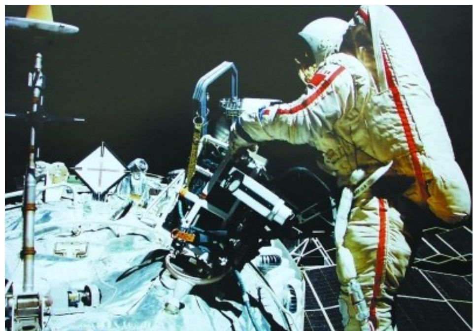
世界第一位在太空中行走的女航天员萨维茨卡娅