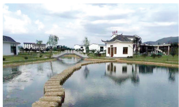
乾泰恒青砖茶厂区