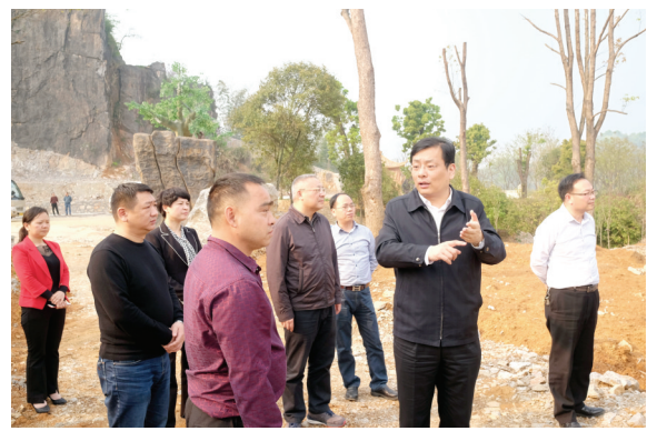
市委书记丁小强调研柳林村乡风文明建设情况