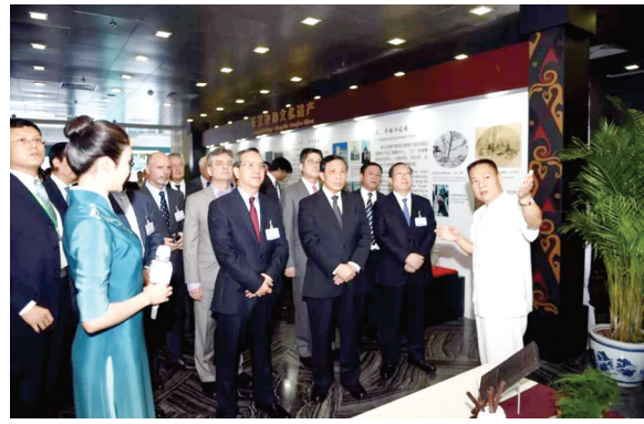
赵李桥青砖茶从外交部蓝色大厅走向世界舞台