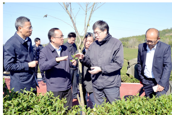
国家发改委调研组调研万亩茶园·俄罗斯方块小镇