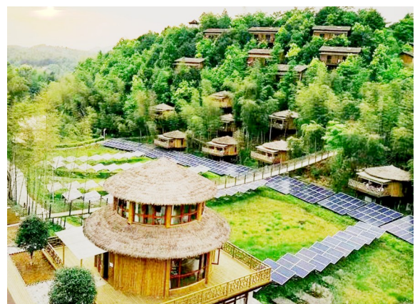
湖北梵音瑜伽静修中心