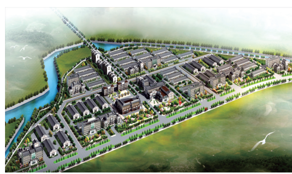
赵李桥青砖茶产业园规划效果图