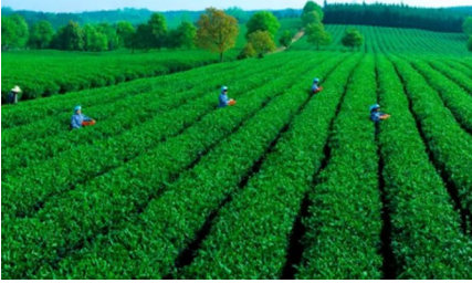
◆万亩茶园·俄罗斯方块小镇◆

今年的五月刚好是采春茶的好时节。万亩茶园·俄罗斯方块小镇位于茶马古道之源赤壁羊楼洞,是全球首家茶文化俄罗斯风情主题公园。不仅有俄罗斯风情商业街,还有茶马古道景区,在这里你可以了解茶文化、体验茶业采摘、制作加工的工艺。在小镇内,游客们可以在劳动中体验旅游的乐趣。