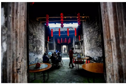
◆通山石门村长夏版古居◆