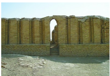
古苏美尔城市(今伊拉克一带)的拱门