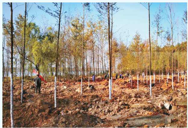
原江边餐馆群变防护林