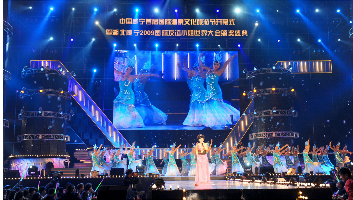
2009年首届国际温泉文化旅游节开幕式

“温泉文化”这个日益靓丽的品牌,正牵动中国与世界更多热切的目光。 一场大文化的盛宴,正在咸宁大地联袂上演。 近年来,我市充分挖掘地方特色文化资源,大力发展以“大文化、大旅游、大健康”为龙头的现代服务业,规划建设“一城十区二十景”,着力打造一批富有特色和影响力的文化产业基地,推动文化与资本、文化与产业、文化与城市建设融合发展,加快推进文化大市向文化强市跨越。 全市歌舞百花齐放、精品叠出。市直的《梦寻咸宁》、赤壁市的《千古风流》、通山县的《白云深处》、咸安区的《千桥流水桂花香》、崇阳县的《沸水河畔》,为地方文化产业、经济发展搭建了流光溢彩的舞台,为群众提供了应接不暇的精神大餐。