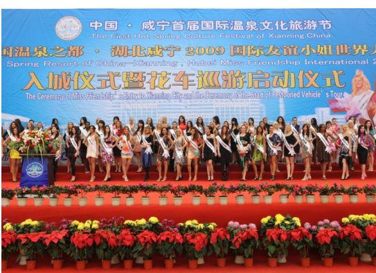
国际友谊小姐世界大会入城式