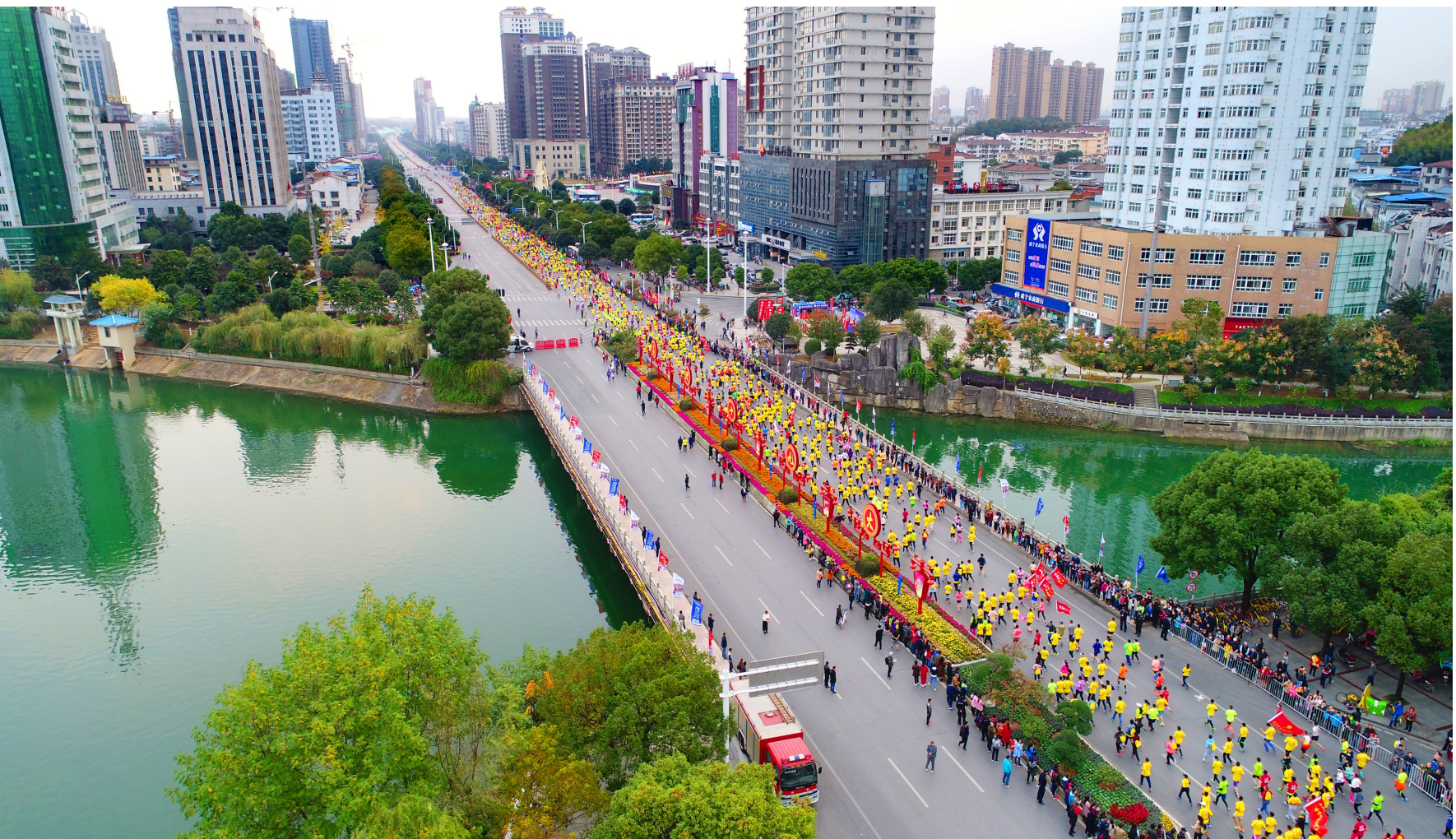
咸宁国际温泉马拉松

近年来,咸宁市物质文化遗产的保护利用呈井喷之势。2012年,全市国家级重点文物保护单位只有两处,至2013年一年全市新增6个国家级文物保护单位。全国重点文物保护单位向阳湖文化名人旧址、沈鸿英故居维修工程正式启动,正在抓紧施工。万里茶道的开发和传统村落的保护扎实推进。羊楼洞明清石板街已纳入《万里茶道(湖北段)申遗推荐名单》,力争成为《万里茶道申遗点名单》。 目前,咸宁市6000多项“非遗”保护四级体系基本完成。崇阳提琴戏入选国家级名录,通城瑶族拍打舞、通山杨芳豆豉腌制技艺等17个人选省级名录;1人入选国家级名录项目代表性传承人,11人入选省级传承人。此外,省级风物项目《赵李桥黑茶制作技艺》、《通山木雕》、《镇氏风湿病疗法及马钱子秘方》成功申