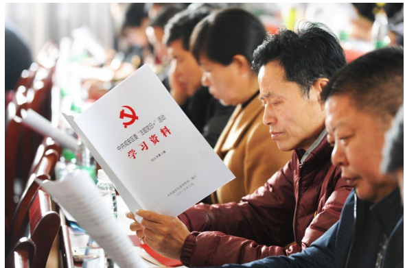
基层“支部主题党日”活动现场