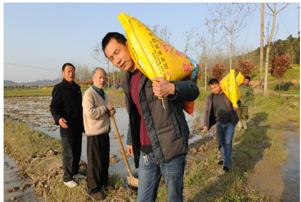
党员为贫困户送化肥