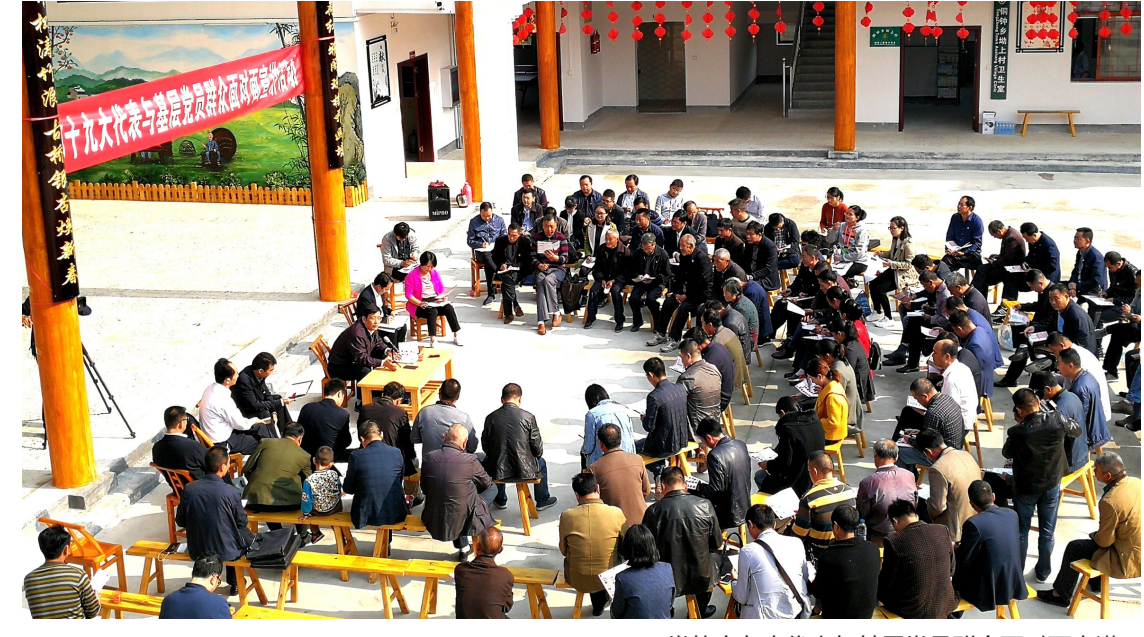
党的十九大代表与基层党员群众面对面宣讲