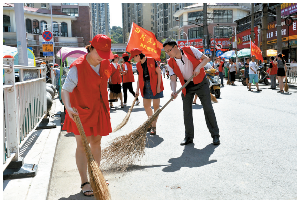
党员义工社区服务