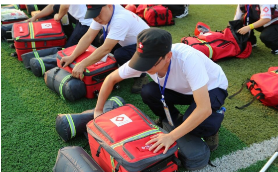
突发事件应急技能演练