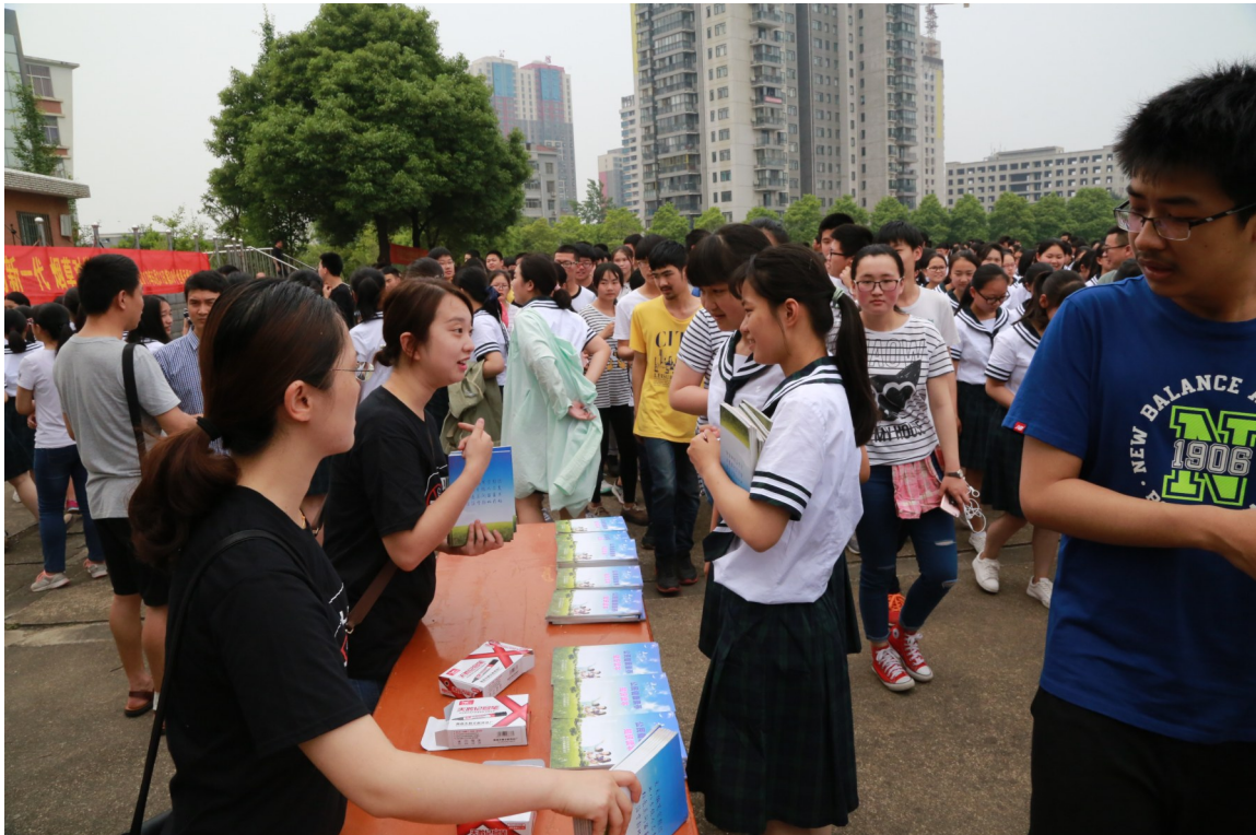
无烟日积极开展宣传活动

经过几年不懈努力,三个国家级项目落地市疾控中心,一个基建项目(国家重大传染病基础设施建设项目及健康管理中心建设项目),一个体系建设项目(国家食品安全风险监测体系建设项目)、一个科研项目(国家心血管病高危人群早期筛查与综合干预项目)同时进行。基建项目方面,国家发改委批准咸宁市疾控中心新建实验楼及业务楼5800平方米,市发改委批准中心同步建设咸宁市健康管理中心3200平方米,整体搬迁建筑面积共9000平方米,现已竣工并完成整体搬迁。食安项目也已完成二个批次所有仪器设备的招标采购,使用项目资金约609万元;心血管病项目在全中心的共同努力下,已连续开展三年,为辖区近百万居民提供了免费的心血管病筛查。这些项目的落地实施,对市疾控中心软硬件实力的提升起到了极大的推动作用。