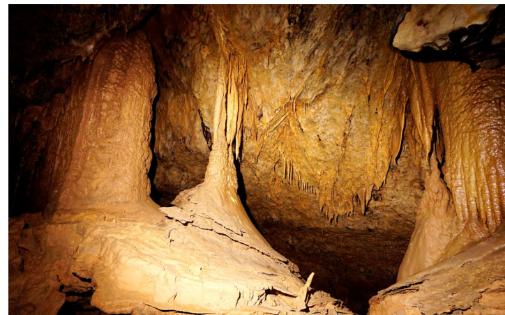
新探测的洞中景观三