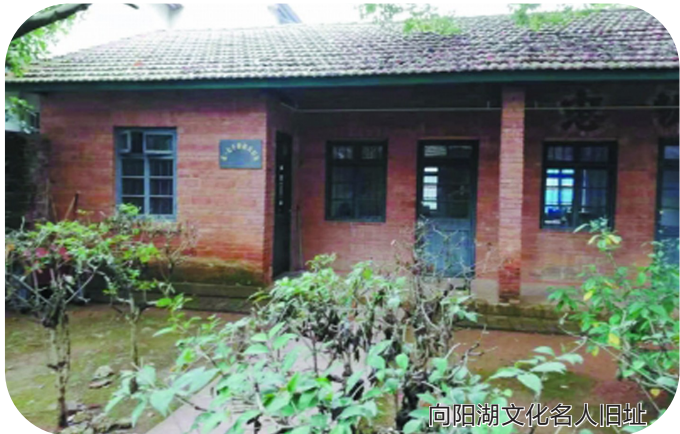
向阳湖文化名人旧址

向阳湖位于咸宁市咸安区西北,向阳湖并不是它的本名。古时候,这里是“云梦泽”的一部分,水天相连,人迹罕至,后成为长江的泄洪通道,湖滩成片,沼泽接连,被当地人称作“关阳湖”。1968年,政府决定在此围垦。一年后,来到此地的文化人为了表达革命乐观主义精神,将关阳湖改名为向阳湖。他们认为“关”“向”虽一字之差,但这样一改,“意义十分重大”。