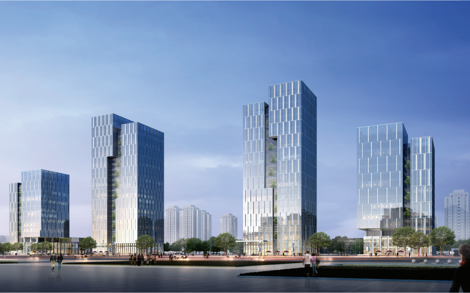
咸宁金融港效果图