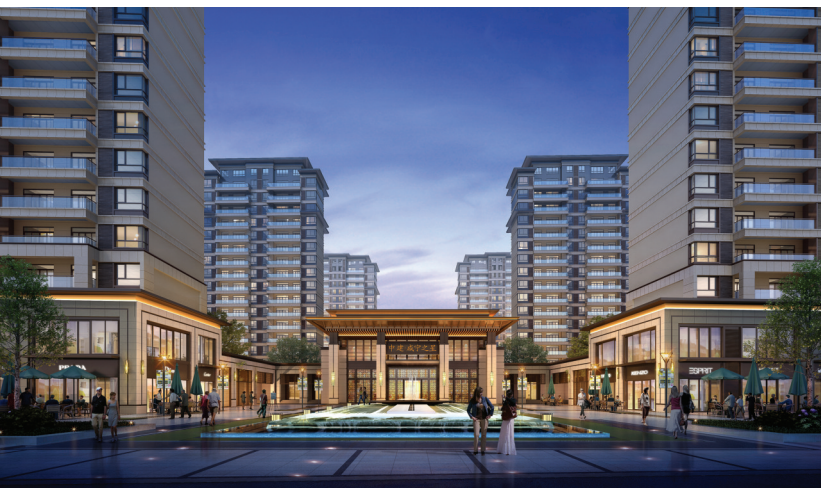
中建·咸宁之星效果图