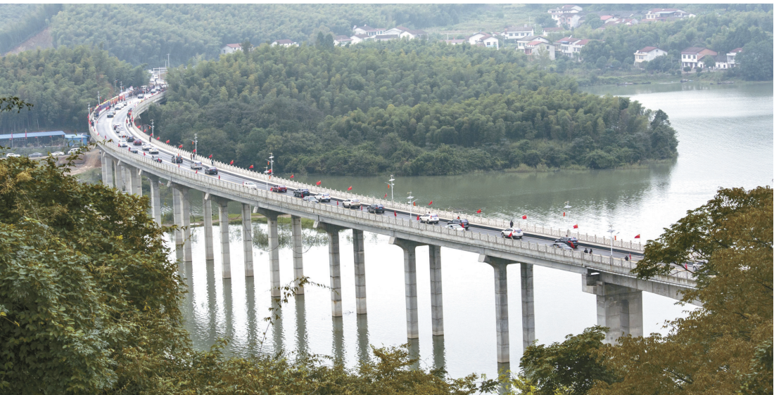
芳世湾大桥建成通车