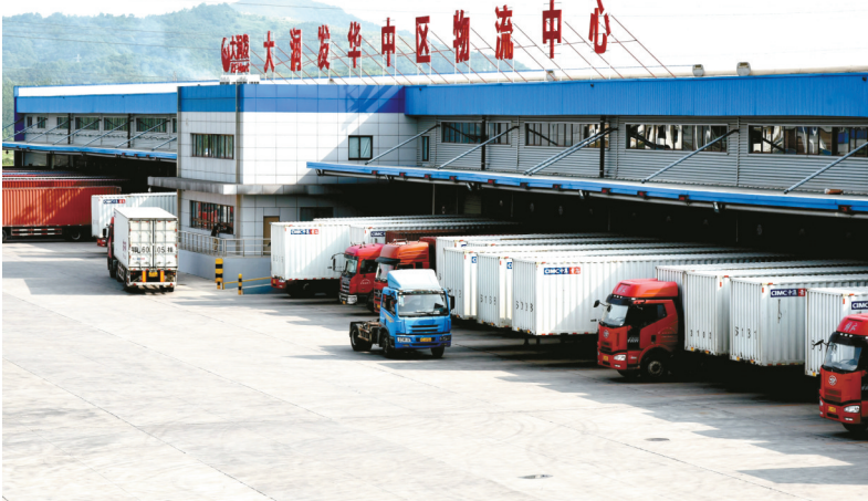
大润发华中区物流中心