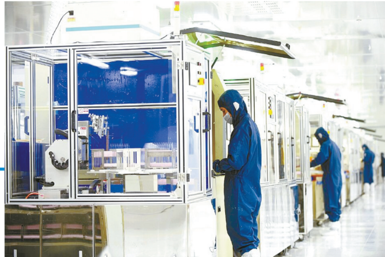
维达力实业(赤壁)有限公司生产车间