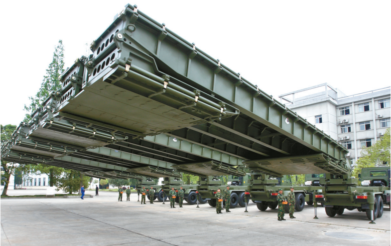
华舟重工产品铁路站台车