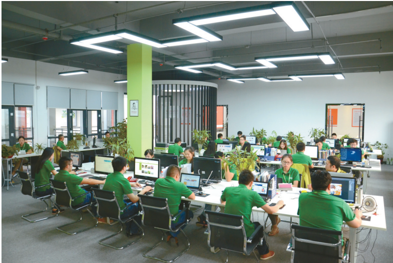
绿购网电子商务平台