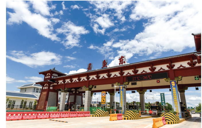
嘉鱼高速嘉鱼东出口