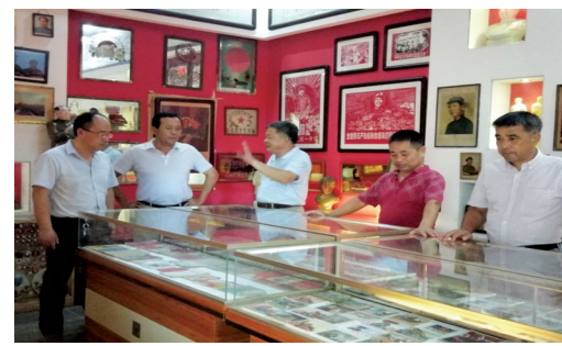
观看毛主席像时勾起游人对伟人无限怀念