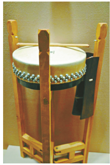
京剧武场乐器板鼓

再说光绪帝载湉,他倒是不爱粉墨登场,却喜爱京剧乐队,尤其是武场乐器板鼓。戏剧史家王芷章在其《清代伶官传》名鼓师沈立成(沈大)条目下记载:“光绪亲政后,万几之暇,最嗜击鼓,即召立成入内,亲从受业,十余年如一日,尔时帝居瀛台之日多……不时唤诸乐工往……皆使彼等,先候于殿内,铺以红氍,半坐跪其上,帝至,即可开始击打。”据此记载,可知光绪帝不仅亲自打鼓,还有名师授艺,勤奋练习十余年不间断,所以颇有造诣。另外,《清代伶官传》又在名鼓师杨乃庆条目下记载:“帝于政事余闲,则辄手自击鼓,以为戏乐!惟击鼓,必须用大小锣为助,方成节奏。长庆击按轻松,声响而逸,帝之打鼓,借此益彰其美!”由此可见,光绪帝载湉真是由衷喜爱“敲锣打鼓”了。