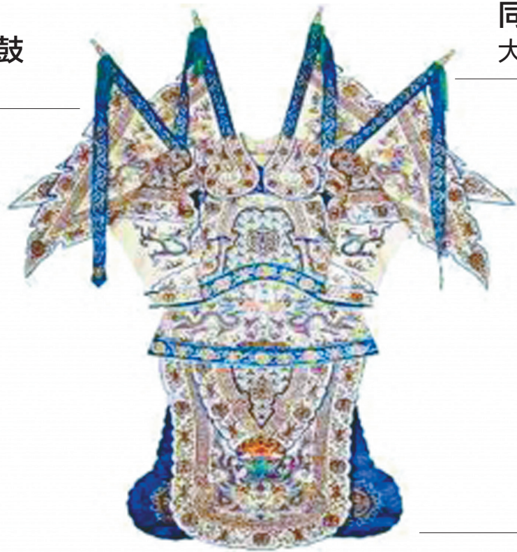
白缎三灰彩绣男大靠