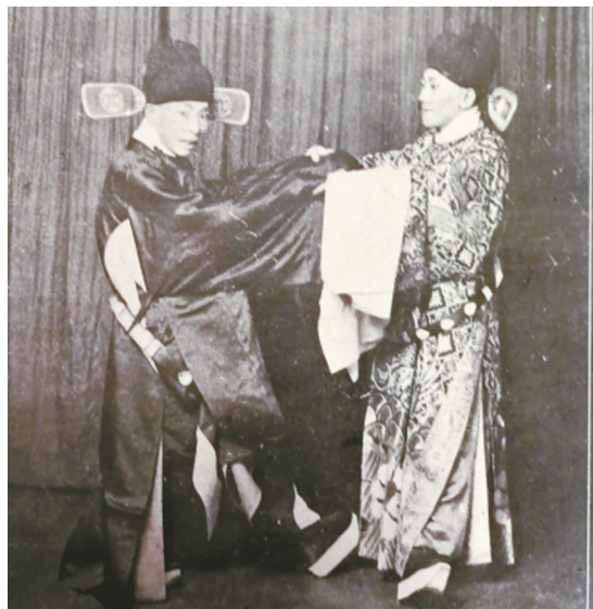
袁克文、程继先《奇双会》剧照