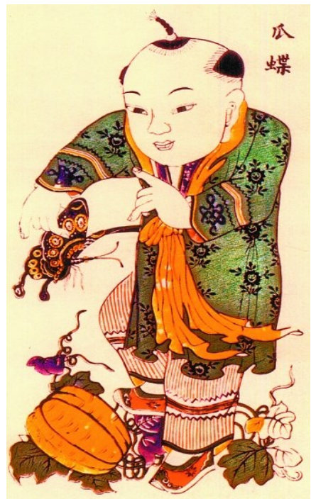
清代山东平度版画《瓜瓞富贵》之“瓜瓞”,男孩子拿蝴蝶,脚踏瓜果。

妻为一场“鸳鸯蝴蝶梦”也由此而来。蝴蝶还是长寿的化身则与“蝴蝶”一名有关。古称八九十岁为“耄耋(mào dié)”,耄与“蝶”谐音,蝴蝶因此成为传统吉祥图案长寿元素。“蝶”又与“鹿(lù)”谐音,吉祥画“瓜瓞绵绵”绘的便是长丝瓜和蝴蝶;“瓜瓞富贵”,则是瓜、蝶、蝙蝠、桂花四物。