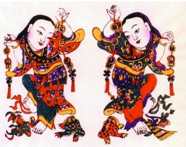
清代山东潍坊杨家埠版画《刘海戏金蟾》,上绘三足蟾。

因为蟾是月精,仙女所化,又是仙虫,食之还能延年益寿。晋郭璞《玄中记》称:“千岁蟾蜍,头生角,得而食之,寿千岁。”有一种“蛤蟆丸”最灵验,《太平御览·兽部十九》引《乐府歌诗》称:“采取神药山之端,白兔捣成蛤蟆丸,奉上陛下下一玉杯。”因为蛤蟆丸得之不易,人称“仙药”。(本报综合)