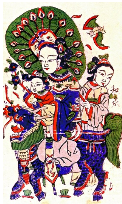
清代河南朱仙镇版画《天仙子》,上面绘有蝙蝠和牡丹花,寓意大富大贵。

如此不受待见的蝙蝠为何能成为吉祥物?讨巧在其名字,“蝠”谐音“福”。清孟超然《亦园亭全集·瓜棚避暑录》称:“虫之属最可厌莫如蝙蝠,而今之织绣图画皆用之,以与‘福’同音也。”清蒋士铨《愤生天彭画<耄耋图>赠百泉》诗也称:“世人爱吉祥,画师工颂祷。谐声而取譬,隐语更造。蝠鹿与蜂猴,乾磬及花鸟。”古人视蝠鹿为“福禄”、蜂猴为“封侯”,再加上“千岁蝙蝠”之长寿说,蝙蝠可谓是有“福”又有“寿”,所以过去民间含“福”吉祥图案如“福在眼前”、“五福临门”、“百福图”、“福寿图”、“福寿双全”、“纳福迎祥”……都以蝙蝠形象入画。