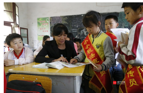
5月11日,通城县地税局在上场小学成立了“小小税法宣传小分队”,税务干部们与税法宣传队员们一起为老师和学生们进行税法宣传。

对此,经常来办税的张老板深有感触地说:“过去,我觉得税务机关是个执法部门,现在,我感觉自己像一名顾客,不仅仅是履行纳税义务,更是来享受纳税服务。”