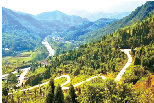
幕阜山生态旅游公路