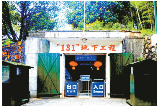
澄水寺幽(131)地下工程

市人大常委会副主任方松对我市旅游下一步工作提出了三点要求:一要坚持法治思维,努力提高依法治旅水平;二要坚持问题导向,努力破解制约旅游发展的难题;三要坚持久久为功,努力实现咸宁旅游新的跨越。