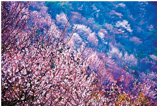
春路葛仙山,恋上樱花海