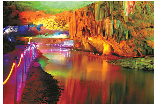
洞天华中,中华天洞