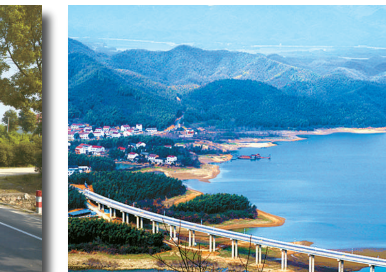
S361大羊线芳台湾大桥