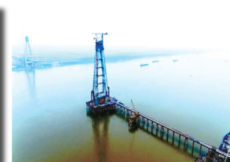
建设中的嘉鱼长江公路大桥