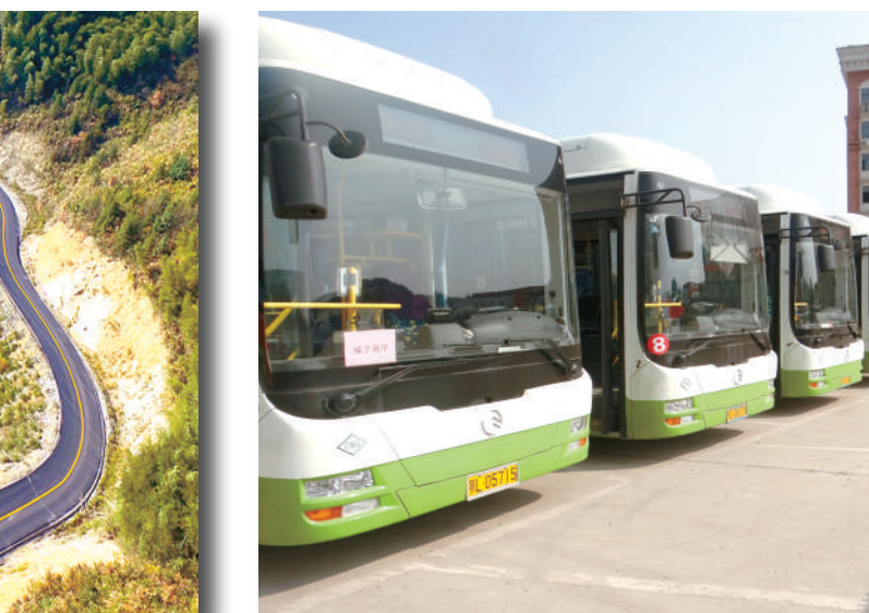
咸宁市城区纯电动公交车