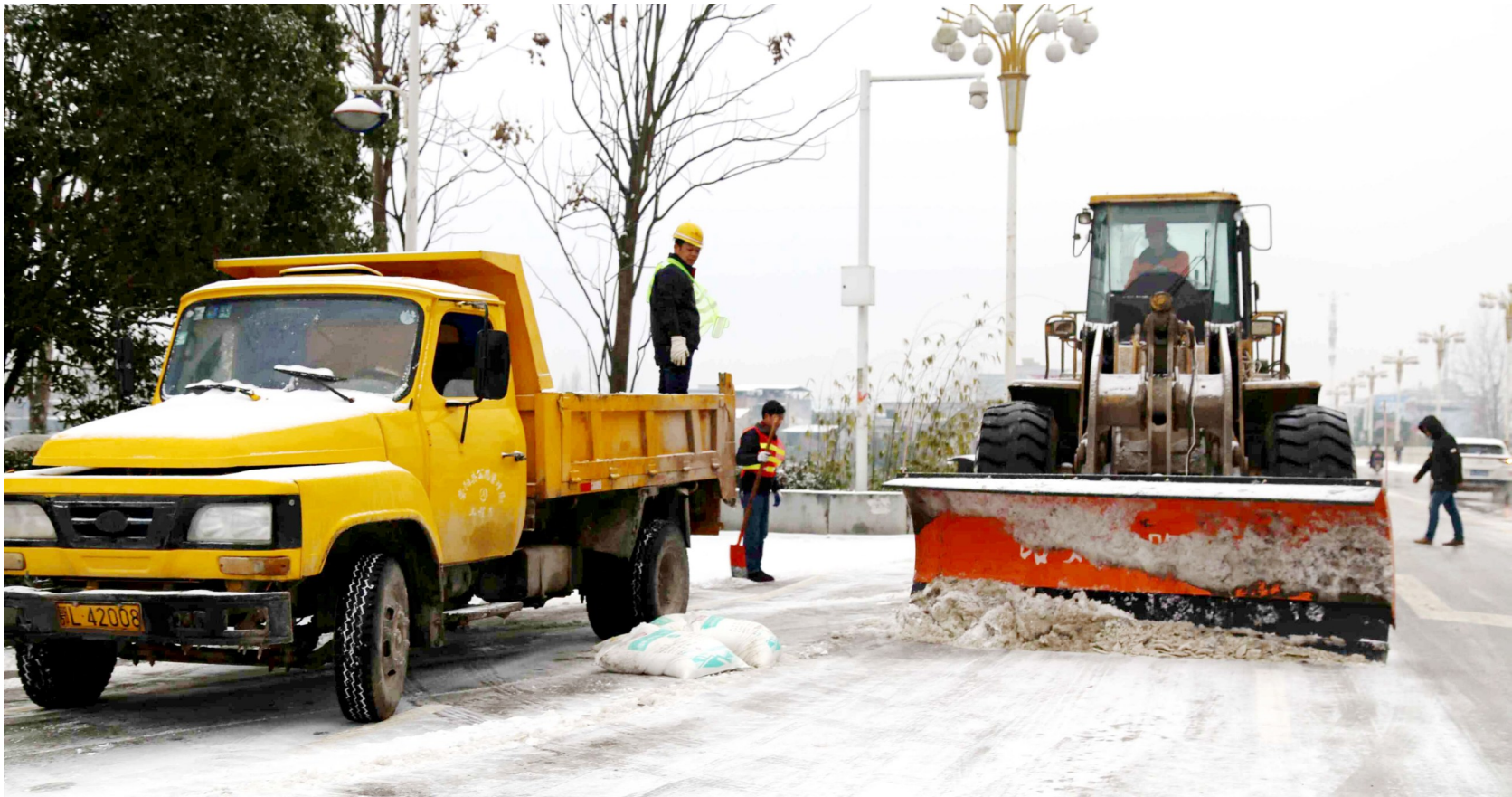
机械除雪