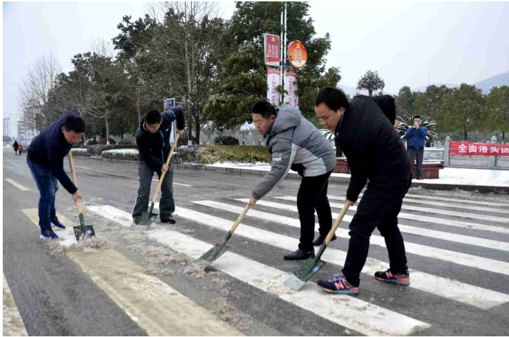
机关干部扫雪