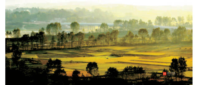
田园秋色