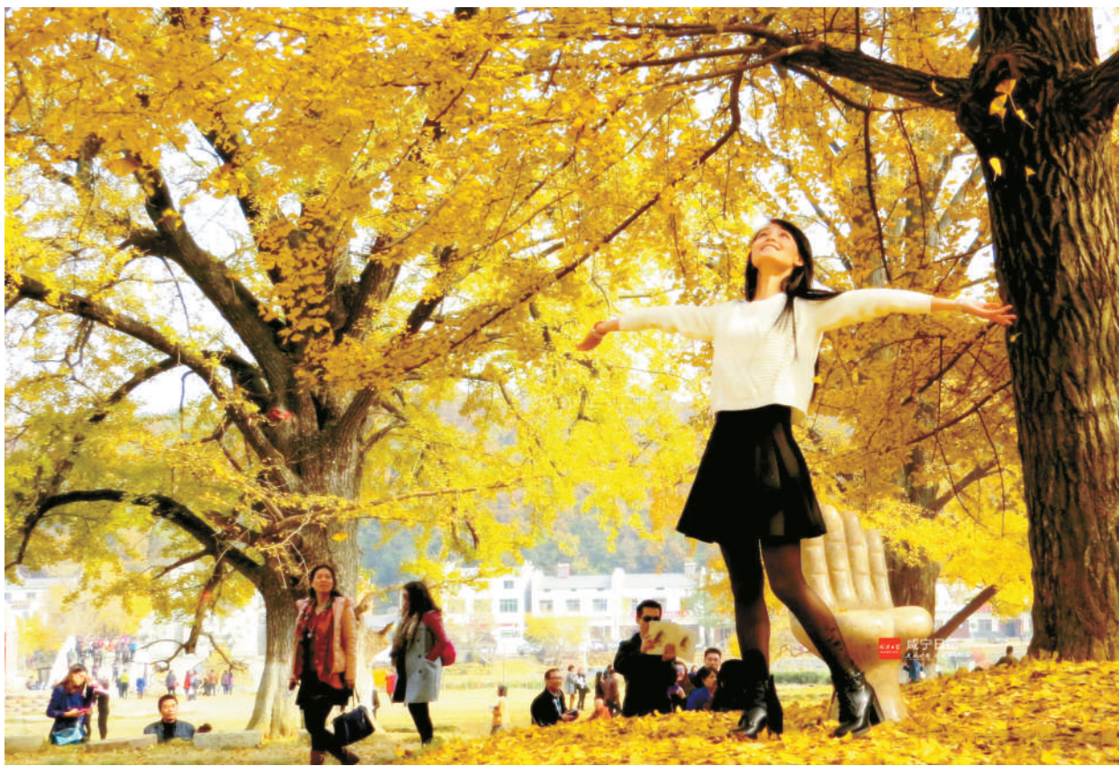
乐秋 霍世祥 摄