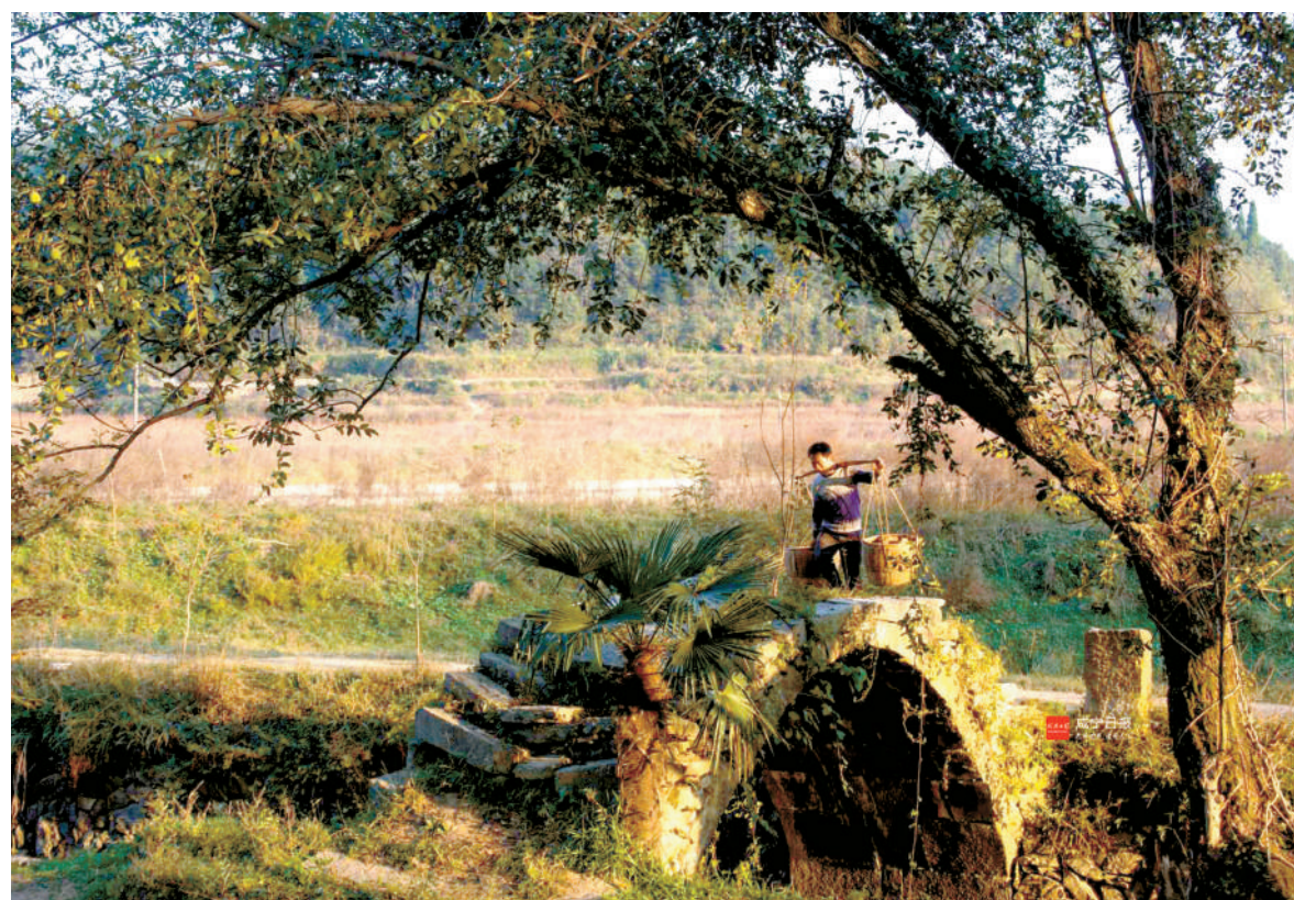
古桥秋景