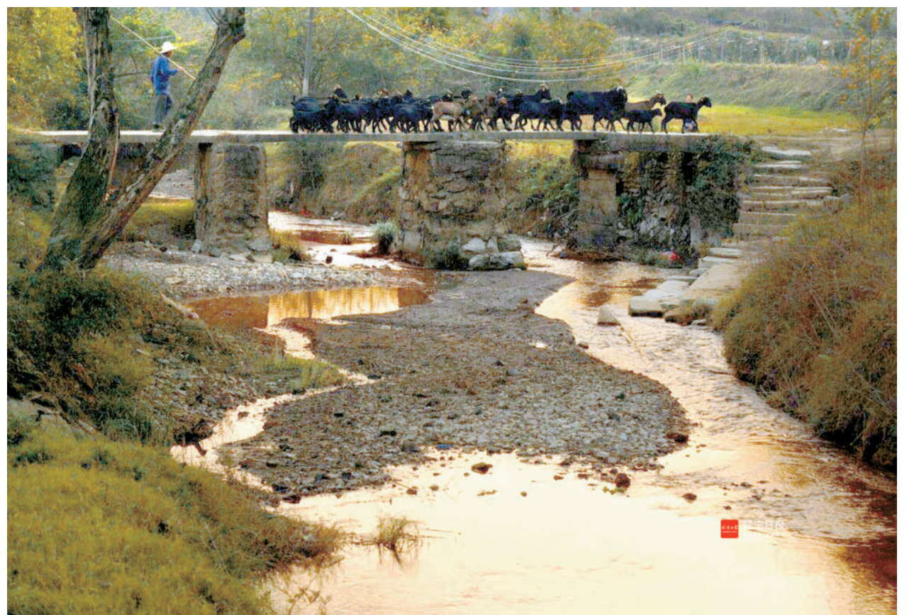
小桥流水人家