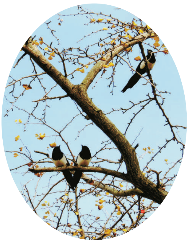
鸣秋 霍世祥 摄