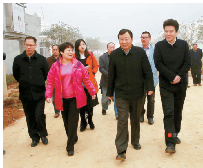
市委副书记、市长王远鹤到崇阳调研