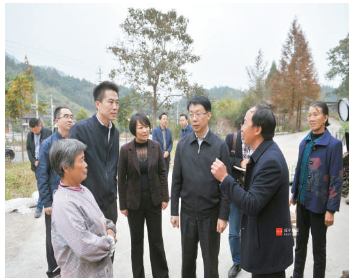
省委常委、组织部部长于绍良在坳上村慰问困难群众