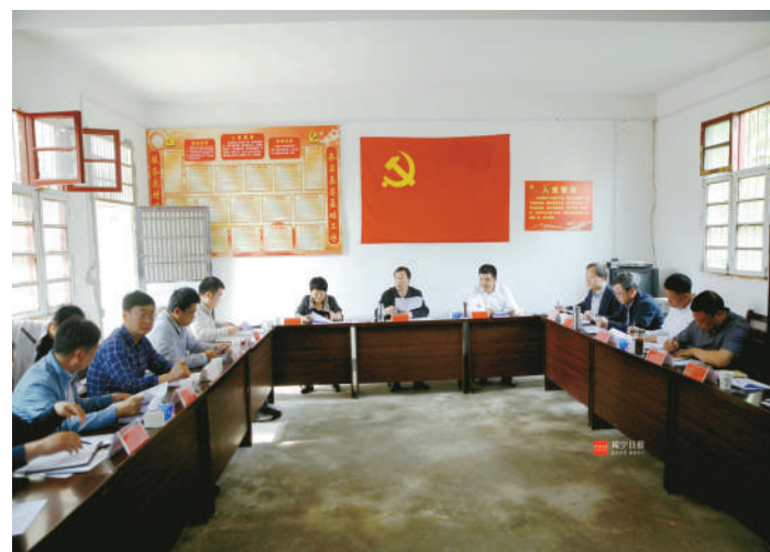
党代表先锋基层行活动走进天城镇