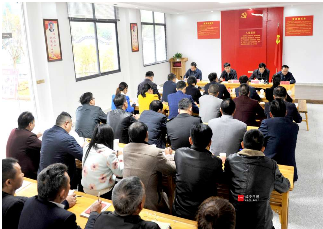
省委常委、组织部部长于绍良宣讲十九大精神