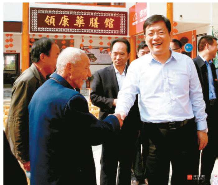
市委书记、市人大常委会主任丁小强到崇阳宣讲十九大精神

坚持在抄中思。活学活用十九大精神，认真思考十九大对组织工作“大环境”以及“小环境”的精神引领和行为导向，思考如何把工作对接到落实十九大精神中来，从而增强十九大精神对组织工作的牵引力和组织工作实践十九大精神的可操作性。 坚持在抄中悟。自觉把组织工作放到新时代中去，以开放的姿态、眼界、胸襟和举措去谋划、落实、推动工作。找准组织工作与经济社会发展结合点，积极探索服从大局、服务发展的内在规律，围绕科学发展选干部、建队伍、聚人才，强基层、打基础，着力提升组织工作科学化水平。