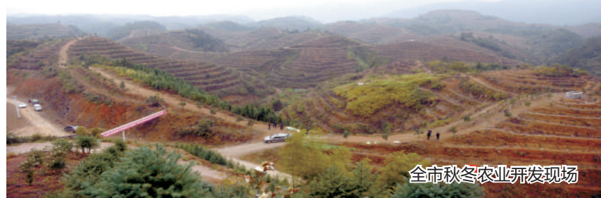
全市秋冬农业开发现场