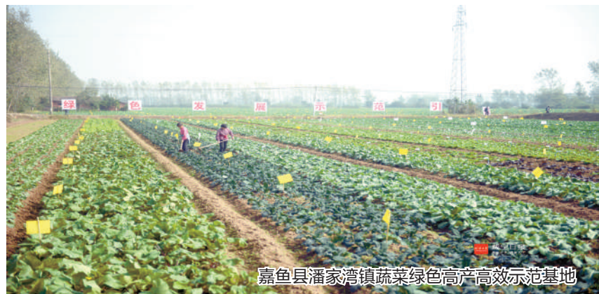
嘉鱼县潘家湾镇蔬菜绿色高产高效示范基地

9、着力抓好冬春农田水利基本建设。建设冬修水利工程2689处,完成土石方1494.04万立方米。完成全市524处水毁工程的修复任务。完成45座水库整险加固工程,实施3处大中型水闸更新改造工程,开展陆水、淦水、长港河、黄沙河重点河段防洪治理工程建设。开展农村饮水工程建设,新增供水人口14.65万人。切实完成5个中央财政支持农田水利建设项目及4个大中型灌区续建配套与节水改造工程。