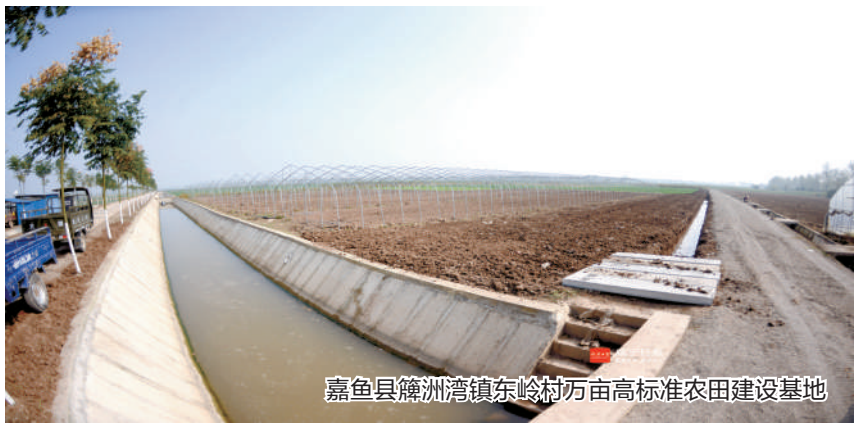
嘉鱼县簰洲湾镇东岭村万亩高标准农田建设基地