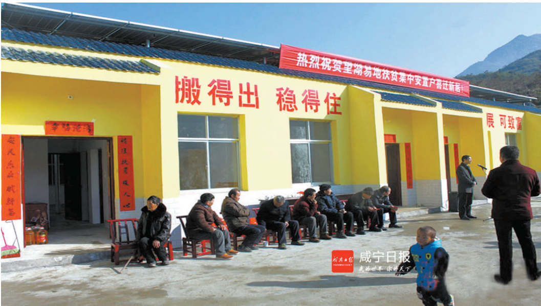
图为通城县隰水镇东港村安置小区

咸宁市幕阜山片区是全国四个连片特困地区之一,是省委省政府确定的全省唯一省级连片特困地区,是全省扶贫攻坚的主战场。全市现有3个省定重点片区县(通山、崇阳、通城)和3个插花贫困县、192个贫困村,需要易地扶贫搬迁的贫困户有1.4万户4.3万人。近年来,农发行咸宁市分行将服务脱贫攻坚作为首要政治任务,牢固树立“扶贫统领”的理念,充分发挥政策性金融职能,全力支持全市脱贫攻坚工作。