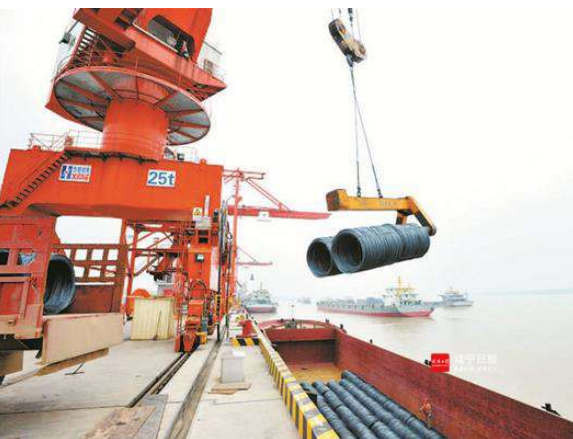
嘉鱼长江岸边,湖北金盛兰冶金科技有限公司的物流综合码头热火朝天。