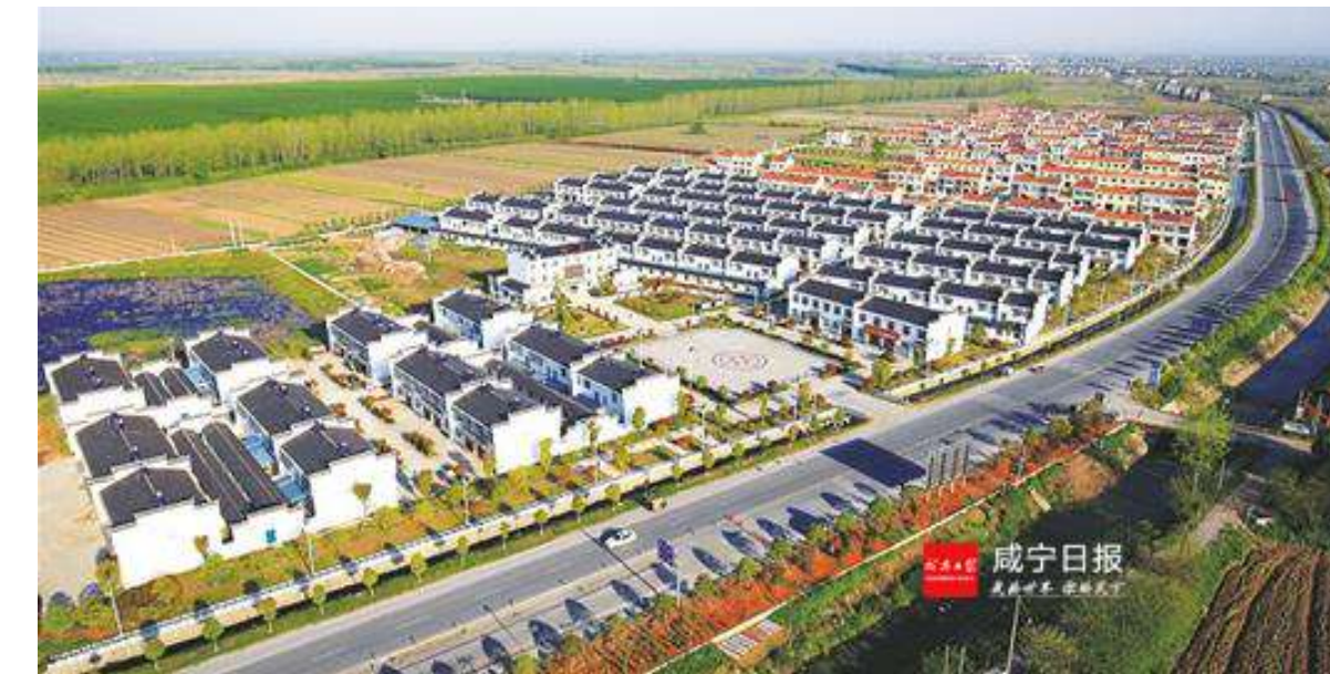
新农村建设示范村——回巴村。

绿色发展拒绝污染 堪称“城市之肺”的三湖连江水库,成为嘉鱼环保重点。取缔投肥养鱼,关闭排污企业,截流处理、综合管网等工程纷纷上马;湖泊水库周边企业、房地产开发等,必须进入排污管网;水库周边度假村、农家乐、旅游宾馆等污水,实现达标排放。 保护中华母亲河。去年3月起,嘉鱼县筹集1000万元资金对长江沿线非法采砂、非法码头、非煤矿山开展专项整治。 该县8家非法码头、12个非法砂石堆场,被全部依法取缔。另外9个码头纳入“规范一批、提升一批”序列。4家非煤矿山被依法注销采矿证,禁采区非煤矿山基本关闭、关停,限采区与非煤矿山企业签订年度目标责任书,加大绿