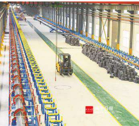
湖北欧特姆绳索制品有限公司车间,这里生产的绳索特用于建设嘉鱼长江大桥。