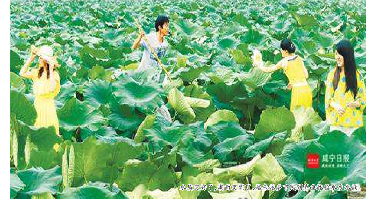
农闲农忙了,物物有归属,地地有归属,人人有归属,金源农业的农户们。

打响嘉鱼新品牌 北有寿光,南有嘉鱼。 素以蔬菜种植闻名的嘉鱼,引导农户将蔬菜生产从数量保障型向质量效益型转变。目前,该县无公害蔬菜标准化生产覆盖率已达95%,建成6个水产标准化健康养殖示范区。 通过实施品牌发展战略,嘉鱼蔬菜在行业中声名鹊起。该县“三品一标”总数229个,“嘉鱼珍珠莲藕”“嘉鱼甘蓝”获得国家地理标志证明商标,“嘉鱼鱼圆”成为国家地理标志保护产品。带着品牌光环,蔬菜生产向二三产业延伸,产业链越来越长,价值越来越高。 该县还同步编制了乡村旅游示范区发展规划,带动农业、旅游业融合发展。目前已建成以采摘、娱乐、垂钓、餐饮、住宿为特色的休闲山庄、农家乐180家,其中五星级和四星级农家乐各3家。 自创嘉鱼体验农事、采摘水果、享受农家乐,已受到越来越多周边城市市民的热捧。 夯实农业大底盘 传统的嘉鱼蔬菜以露地“南瓜两菜”为主,虽产量高、品质优,但缺少增收增效的潜力。 如何转型升级?近年来,该县以农业供给侧结构性改革为契机,大力发展设施蔬菜,推广绿色蔬菜示范基地,提升蔬菜储运能力。 为解决农产品增产不增收、价格“过山车”等问题,该县今年出台优惠政策,拿出1000万元专项资金支持设施蔬菜基地建设,重点建设4个绿色蔬菜生产试验示范基地和示范点。 通过持续的基础设施建设、系列惠民政策,嘉鱼正在补短板、谋长远,可持续发展的现代化农业款款而来。