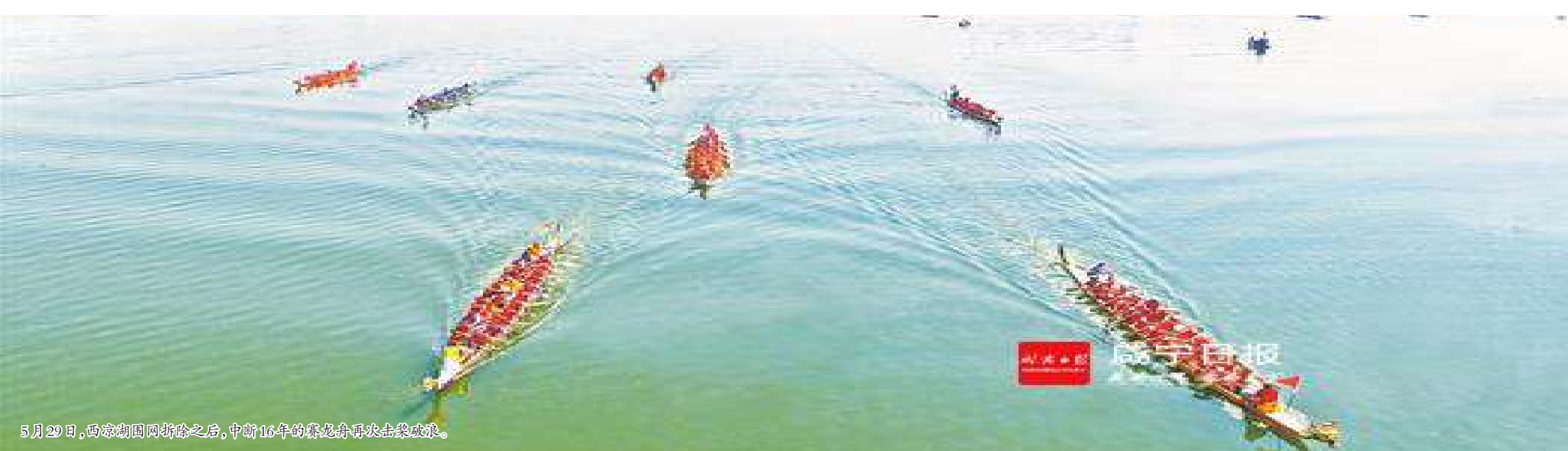
5月20日,向家湾龙舟竞渡之后,中街10年的龙舟赛再次火热起来。

绿色发展拒绝污染 堪称“城市之肺”的三湖连江水库,成为嘉鱼环保重点。取缔投肥养鱼,关闭排污企业,截流处理、综合管网等工程纷纷上马;湖泊水库周边企业、房地产开发等,必须进入排污管网;水库周边度假村、农家乐、旅游宾馆等污水,实现达标排放。 保护中华母亲河。去年3月起,嘉鱼县筹集1000万元资金对长江沿线非法采砂、非法码头、非煤矿山开展专项整治。 该县8家非法码头、12个非法砂石堆场,被全部依法取缔。另外9个码头纳入“规范一批、提升一批”序列。4家非煤矿山被依法注销采矿证,禁采区非煤矿山基本关闭、关停,限采区与非煤矿山企业签订年度目标责任书,加大绿