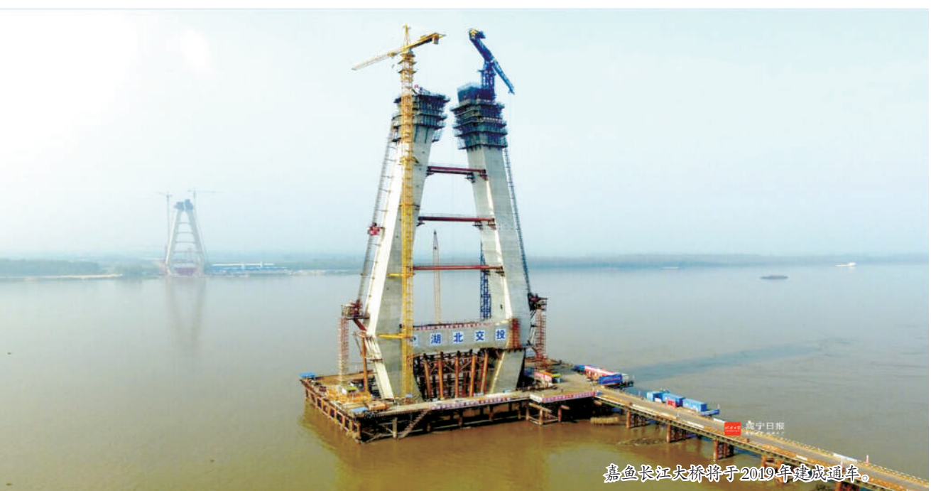
嘉鱼长江大桥桥墩于2016年封顶。