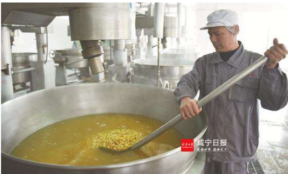
贫困户种植的莲藕被当地农业产业化龙头企业保护收购。

跳出传统老三样 蔬菜、水产、林果是嘉鱼农业的“老三样”。传统的家庭式粗放型生产,品种“小而杂”,形成不了龙头,更产生不了品牌效益。 如何将传统农业做大做强? 嘉鱼给出的答案是:往精品、健康、有机、绿色种植养殖方向,围绕特色产业,做好结构文章。 主动“调”“转”,为农业发展赢得广阔空间。目前,嘉鱼已建成设施精品蔬菜、健康水产、高产优质水稻、有机林果、绿色油茶等板块基地30万亩,新发展小龙虾、鲮鱼、草鱼等特色农产品基地2.4万亩。千亩连片、万亩成区,“一镇一业”“一村一品”的该县八大农业示范区蔚然成型,特色农业活力焕发。 同时,推进农工融合,引入省市级重点龙头企业29家,按照“龙头企业+基地+农户”模式,带动12万余亩特色种养基地抱团发展,实现规模上农产品加工产值227亿元。