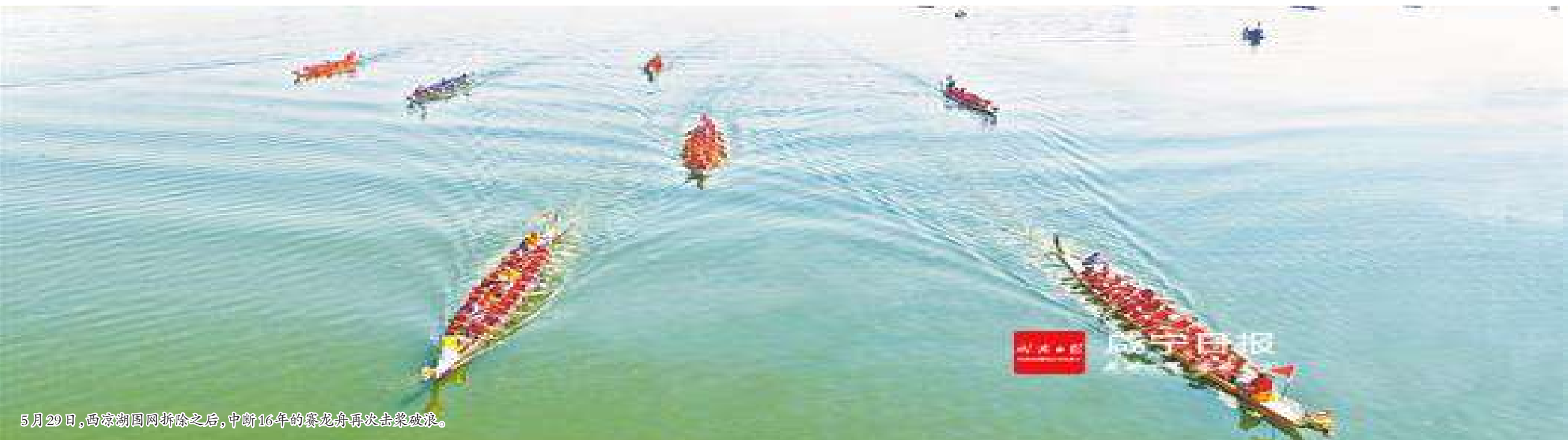
5月29日,向家湾龙舟锦标赛之后,中船16年的龙舟赛再续生态绿底。

据称“城市之肺”的三湖连江水库,成为嘉鱼环保重点。取缔投肥养鱼,关闭排污企业,截流处理,综合管网等工程纷纷上马;湖泊水库周边企业、房地产开发等,必须进入排污管网;水库周边度假村、农家乐、旅游宾馆等污水,实现达标排放。 保护中华母亲河。去年3月起,嘉鱼县筹集1000万元资金对长江沿线非法采砂、非法码头、非煤矿山开展专项整治。 该县8家非法码头、12个非法砂石堆场,被全部依法取缔。另外9个码头纳入“规范一批、提升一批”序列。4家非煤矿山被依法注销采矿证,禁采区非煤矿山基本关闭、关停,限采区与非煤矿山企业签订年度目标责任书,加大绿