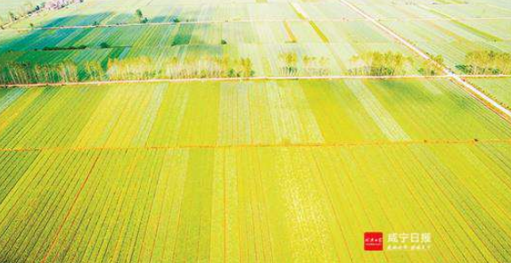
潘家湾十万亩露天蔬菜基地。

跳出传统老三样 蔬菜、水产、林果是嘉鱼农业的“老三样”。传统的家庭式粗放型生产,品种“小而杂”,形成不了龙头,更产生不了品牌效益。 如何将传统农业做大做强? 嘉鱼给出的答案是:往精品、健康、有机、绿色种植养殖方向,围绕特色产业,做好结构文章。 主动“调”“转”,为农业发展赢得广阔空间。目前,嘉鱼已建成设施精品蔬菜、健康水产、高产优质水稻、有机林果、绿色油茶等板块基地30万亩,新发展小龙虾、鲮鱼、草鱼等特色农产品基地2.4万亩。千亩连片、万亩成区,“一镇一业”“一村一品”的该县八大农业示范区蔚然成型,特色农业活力焕发。 同时,推进农工融合,引入省市级重点龙头企业29家,按照“龙头企业+基地+农户”模式,带动12万余亩特色种养基地抱团发展,实现规模上农产品加工产值227亿元。