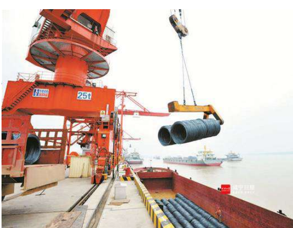
嘉鱼长江岸边,湖北金盛兰冶金科技有限公司的物流综合码头热火朝天。