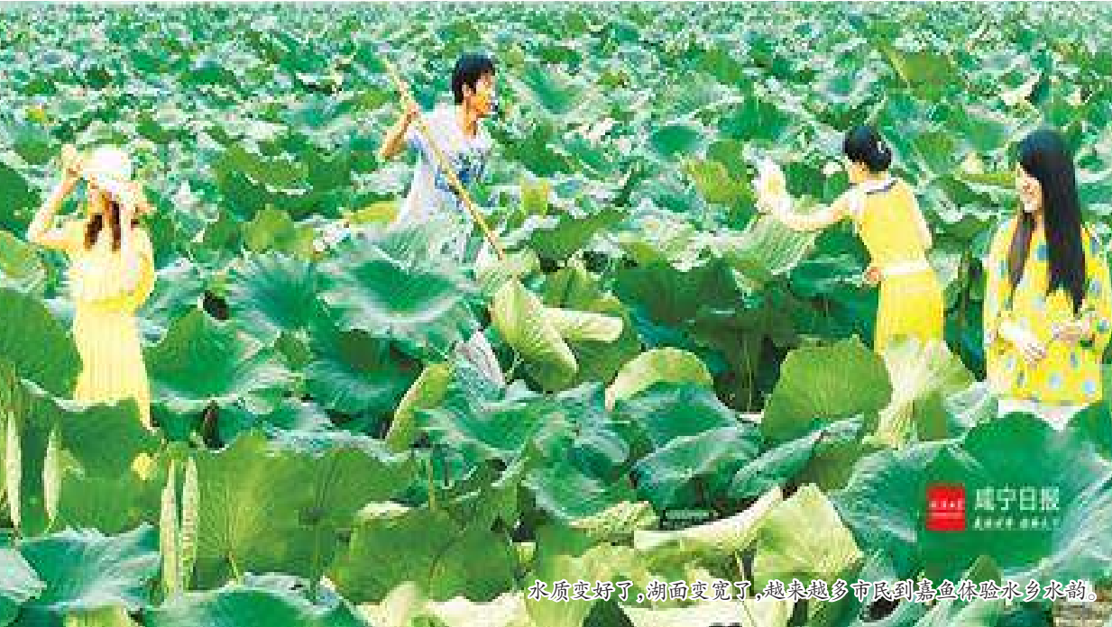
瓜菜收好了,物物交收,地地满载,乡亲们脸上洋溢着喜悦的笑容。

打响嘉鱼新品牌 北有寿光,南有嘉鱼。 素以蔬菜种植闻名的嘉鱼,引导农户将蔬菜生产从数量保障型向质量效益型转变。目前,该县无公害蔬菜标准化生产覆盖率已达95%,建成6个水产标准化健康养殖示范区。 通过实施品牌发展战略,嘉鱼蔬菜在行业中声名鹊起。该县“三品一标”总数229个,“嘉鱼珍珠莲藕”“嘉鱼甘蓝”获得国家地理标志认证证明,“嘉鱼鱼圆”成为国家地理标志保护产品。带着品牌光环,蔬菜生产向二三产业延伸,产业链越来越长,价值越来越高。 该县还同步编制了乡村旅游示范区发展规划,带动农业、旅游业融合发展。目前已建成以采摘、娱乐、垂钓、餐饮、住宿为特色的休闲山庄、农家乐180家,其中五星级和四星级农家乐各3家。 自驾游嘉鱼体验农事,采摘水果、享受农家乐,已受到越来越多周边城市市民的热捧。 夯实农业大底盘 传统的嘉鱼蔬菜以就地“西瓜两菜”为主,虽产量高、品质优,却缺少增收增效的潜力。 如何转型升级?近年来,该县以农业供给侧结构性改革为契机,大力发展设施蔬菜,推广绿色蔬菜示范基地,提升蔬菜储运能力。 为解决农产品增产不增收、价格“过山车”等问题,该县今年出台优惠政策,拿出1000万元专项资金支持设施蔬菜基地建设,重点建设4个绿色蔬菜生产示范基地和示范点。 通过持续的基础设施建设、系列惠民政策,嘉鱼正在补短板、谋长远,可持续发展的现代化农业款款而来。