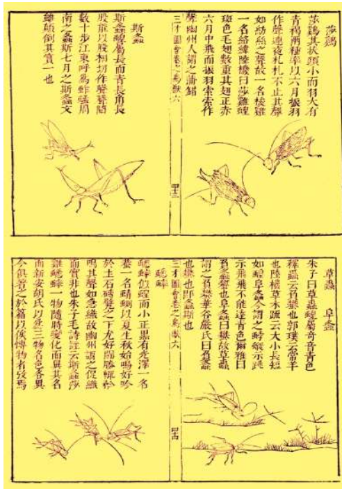
明代王圻《三才图会》中描写的鸣虫