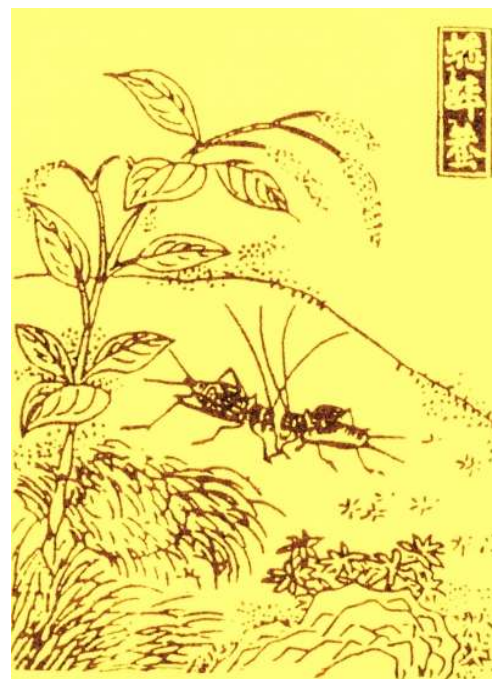
古本《尔雅》插图中的蟋蟀