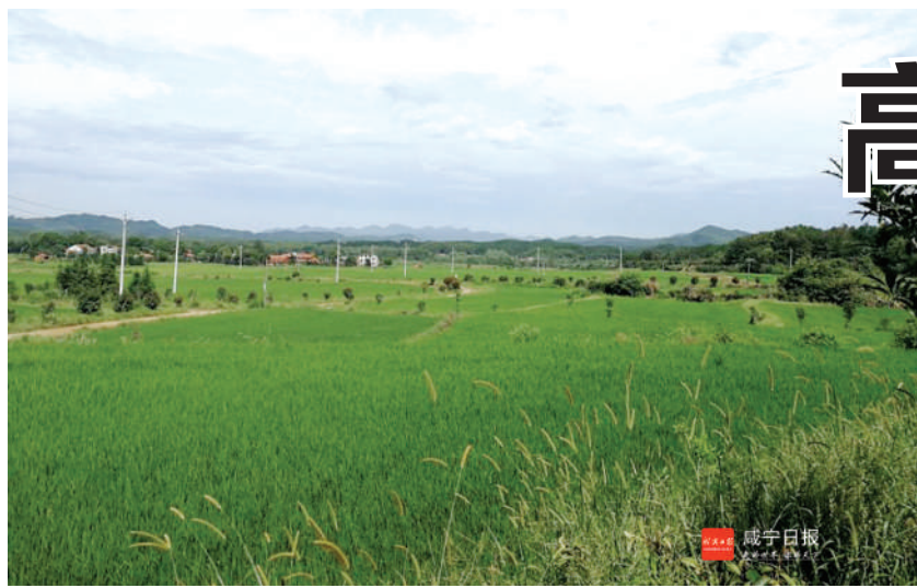
阳光下的高桥白水畝寺背底,将打造成为田园综合体核心区。