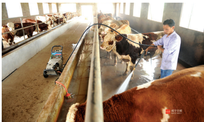
嘉鱼渡普镇杨家咀村福祥养殖专业合作社发展肉牛养殖带动群众脱贫。